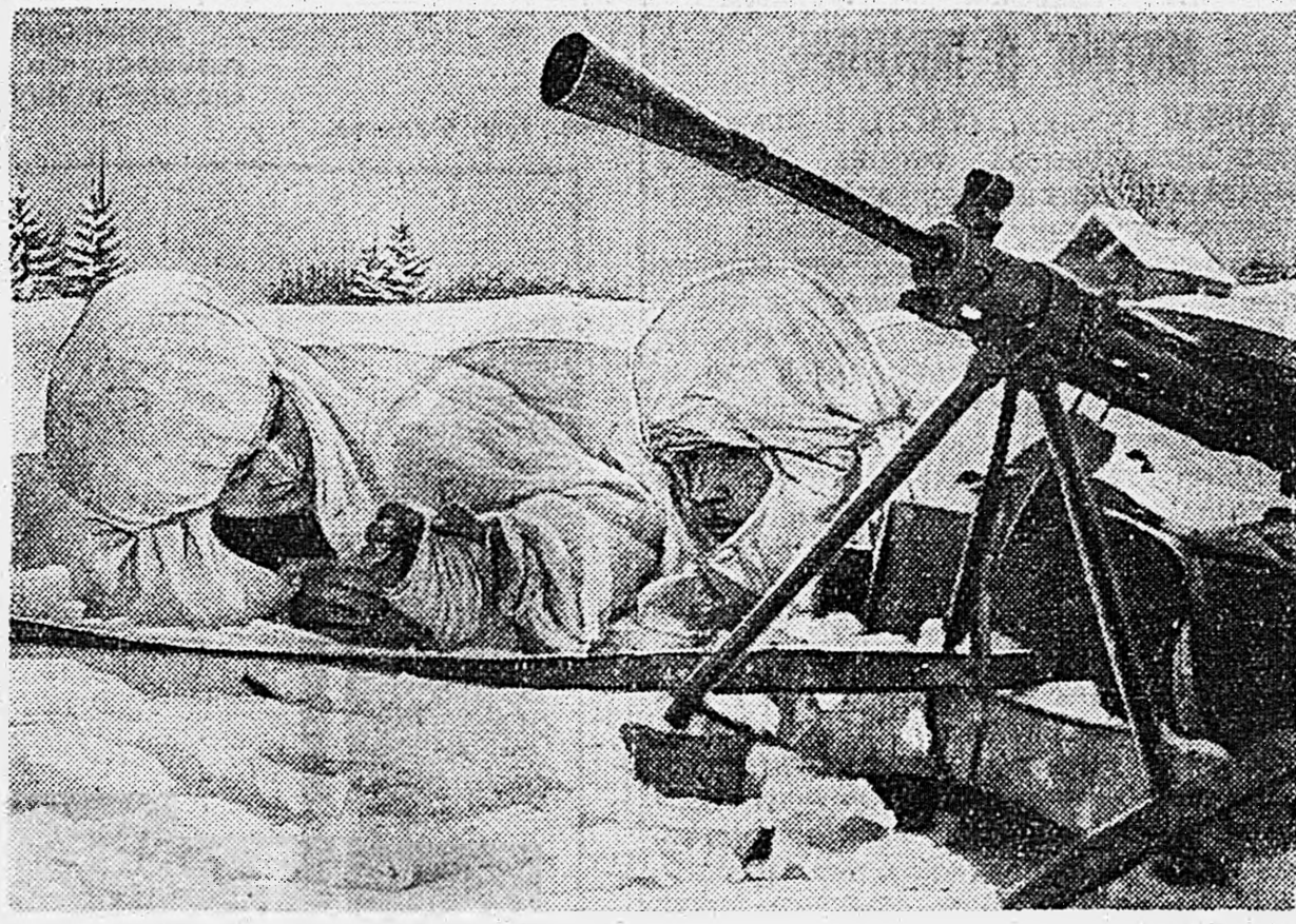
СЕВЕРО-ЗАПАДНЫЙ ФРОНТ. Первая помощь раненому товарищу.