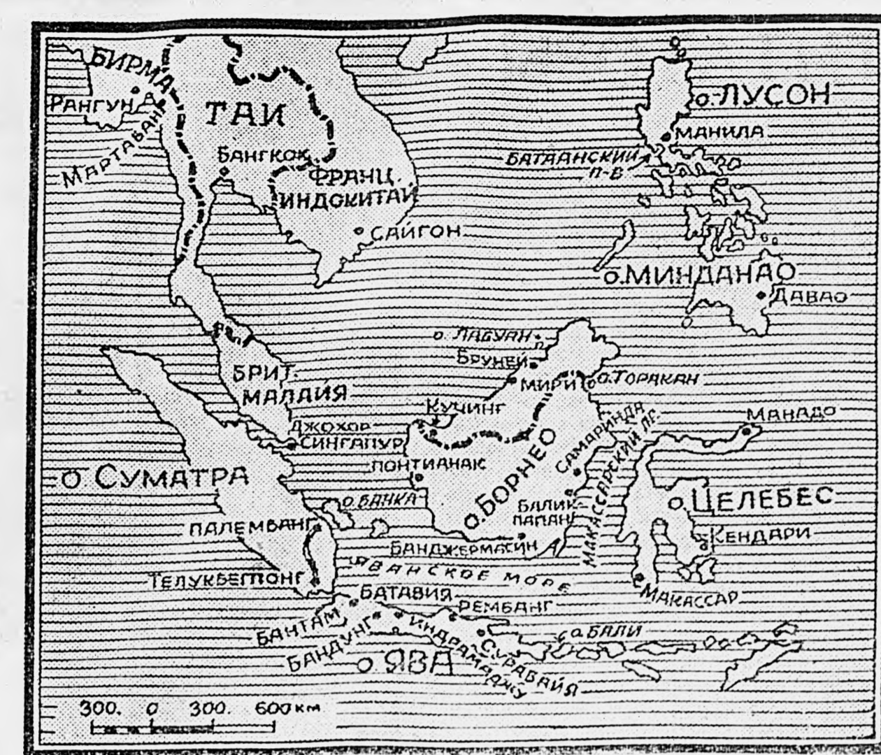
ВОЕННЫЕ ДЕЙСТВИЯ В ИНДОНЕЗИИ