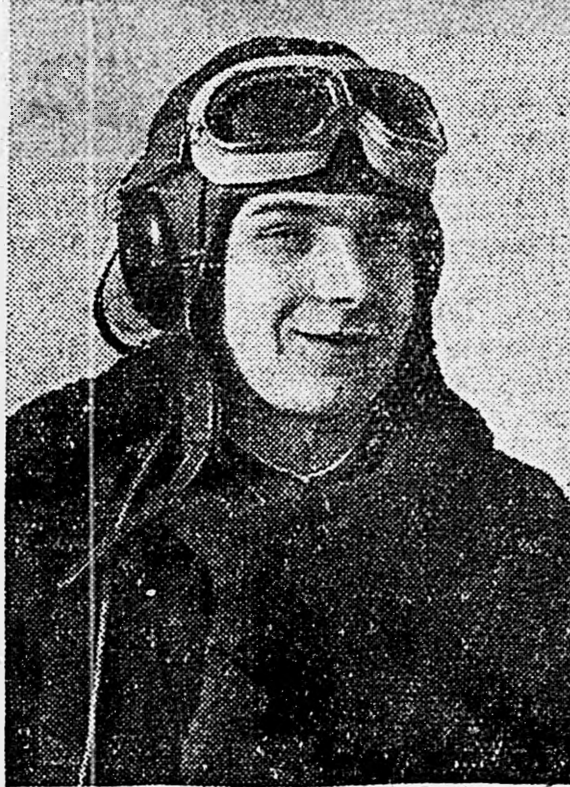
Герой Советского Союза лейтенант И. Ф. Голубини.

ЮЖНЫЙ ФРОНТ, 4 марта. (По телеграфу от наш. спец. корр.) День и ночь идут ожесточенные бои. Части Н соединения продолжают теснить врага. Немцы несут большие урон. Вчера соединение снова отбросило противника на несколько километров. Развилка успех наступления, наши части отбили у фашистов 8 населенных пунктов. Частично эти населенные пункты представляли собой хорошо укрепленные узлы сопротивления, и бои за них носили особенно напряженный характер. Фашисты несколько раз переходили в контратаку, пуская в ход все свои огневые средства, но высокий наступательный порыв наших частей заставил противника отступить, и он не сумел удержать за собой отбитые пункты. Сперва наступление заняли немцы амброс несколько огневых точек. Артиллеристы быстро уничтожили их и восстановили путь наступления пехоте. Почти без потерь наш подразделение вошло в деревню и обстреливал в бегство уцелевших от артиллерийского огня фашистов.