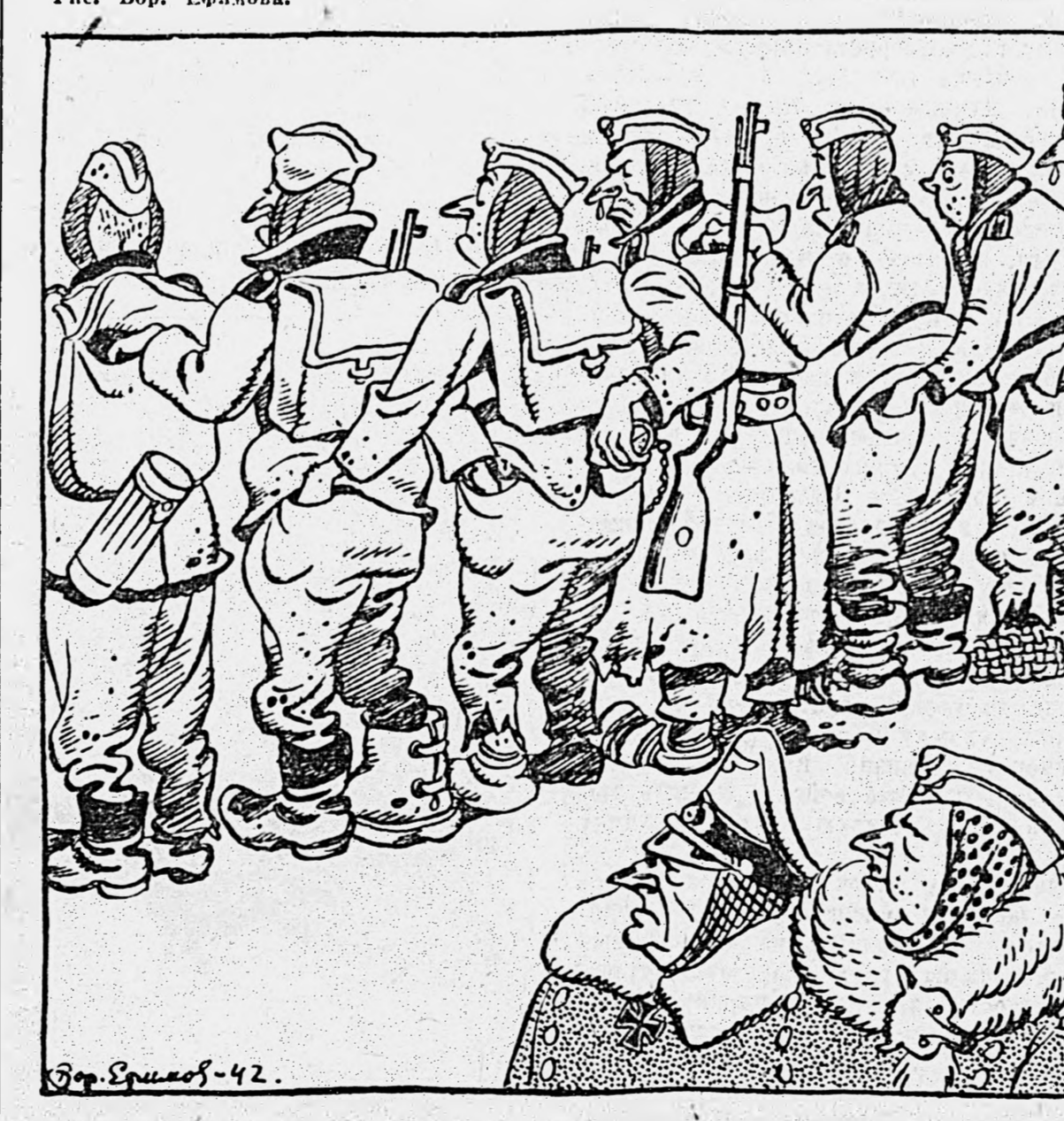
Рис. Бор. Ефимова.

В захваченном нашим частями призае немецкого командира Шефенбергера говорится, что «возросло число солдат, совершивших кражи у своих товарищей».