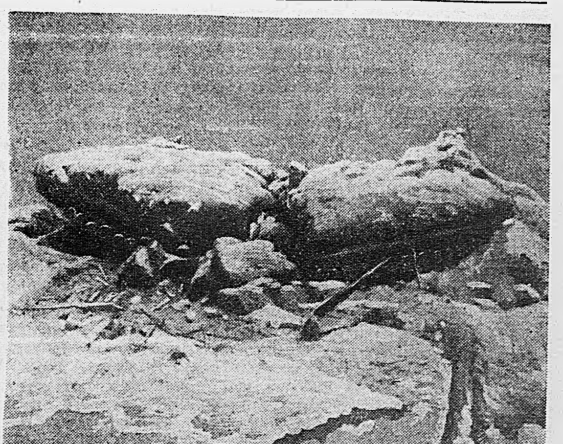
У реки Волхов. Тяжелая батарея, которой командует старший лейтенант Бобров. На снимках: 1. Заряжающиеся орудия. 2. Отличный наводчик Исавев. 3. Орудие старшего сержанта Клименко ведет огонь. 4. Немецкий дот, разбитый орудийным снарядом.