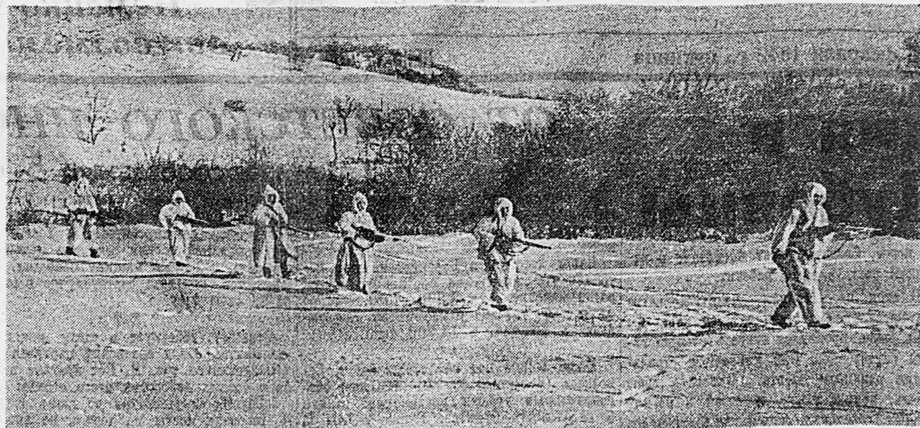
ЮЖНЫЙ ФРОНТ. На снимке: партизаны выходят на разведку.