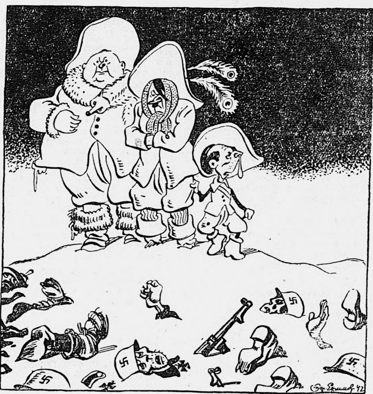
В ожидании весны...

Как сообщают, Гитлер заявил: «Через несколько недель снег в России растает, наступит весна и наши мушкетеры с ружьем в руках снова смогут продвигать наступление».