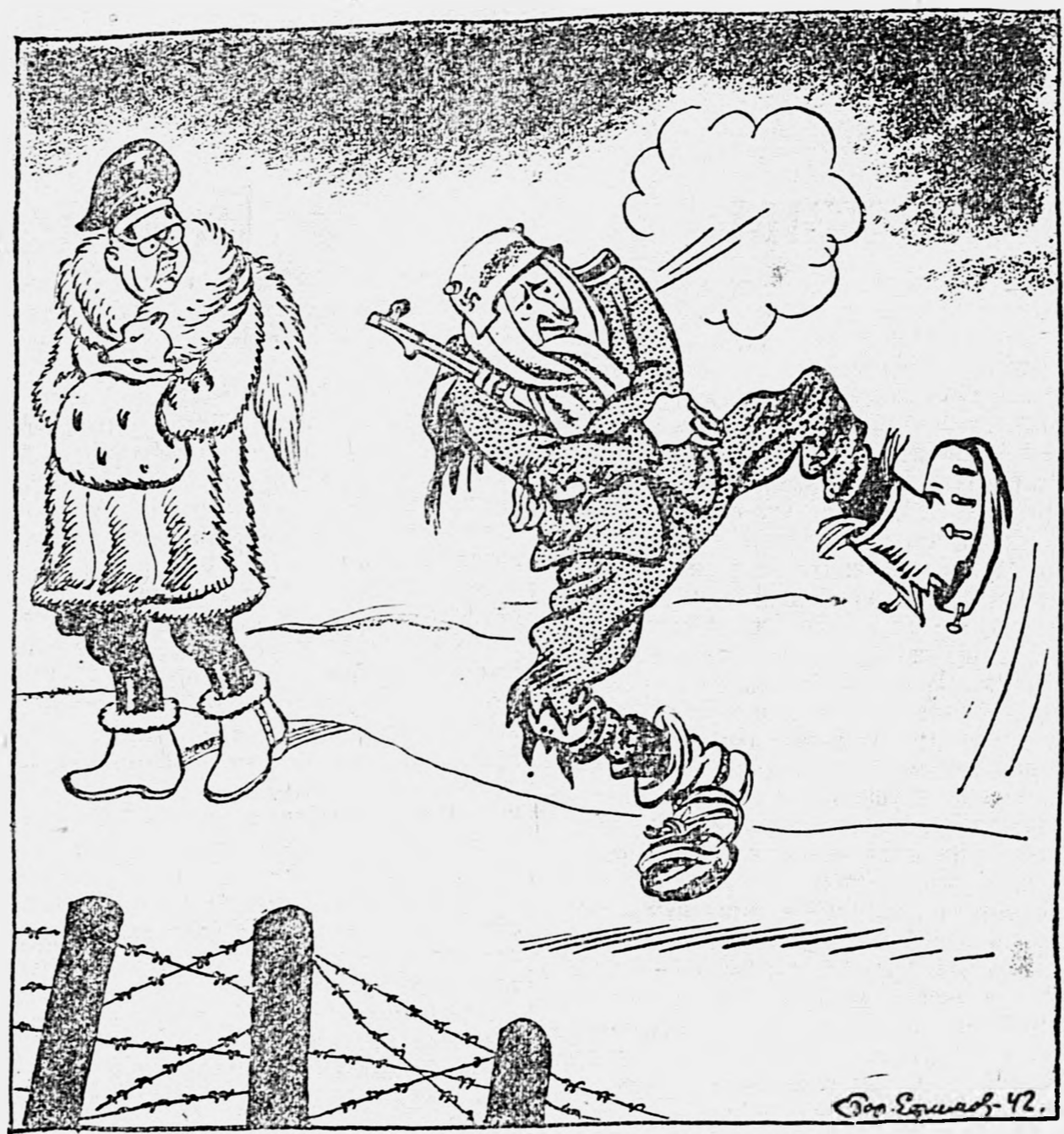
Самый распространенный вид немецкого танца, который продолжается, несмотря на запрещение Гиммлера...

Пис. Бор. Ефимов. Начальник германской полиции Гиммлер запретил всякие танцы.