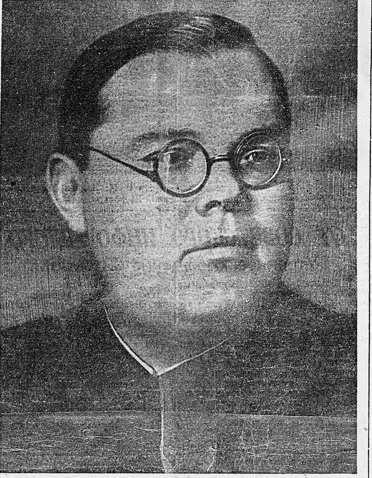
Тов. А. С. Щербаков