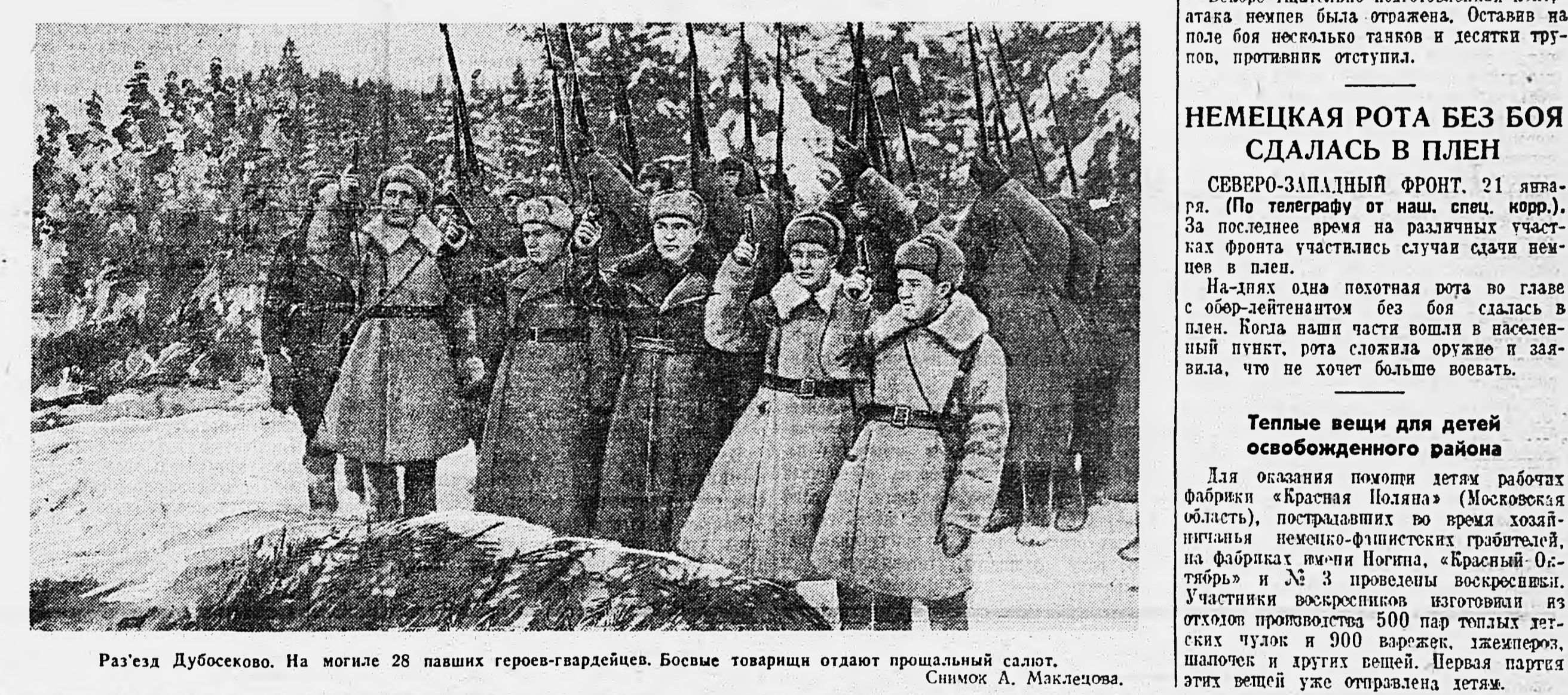
Разезд Дубосеково. На могиле 28 павших героев-гвардейцев. Боевые товарищи отдают прощальный салют.

Теплые вещи для детей освобожденного района Для оказания помощи детям рабочих фабрики «Красная Полана» (Московская область), пострадавшим во время хозяйничанья немецко-фашистских грабителей, на фабриках имени Готмана «Крылья Октябрь» и № 3 проведены восстановительные работы. Участники восстановительных работ отделили 500 пар теплых зимних чулок и 900 варежек, джекейров, шапочек и других вещей. Первая партия этих вещей уже отправлена детям.