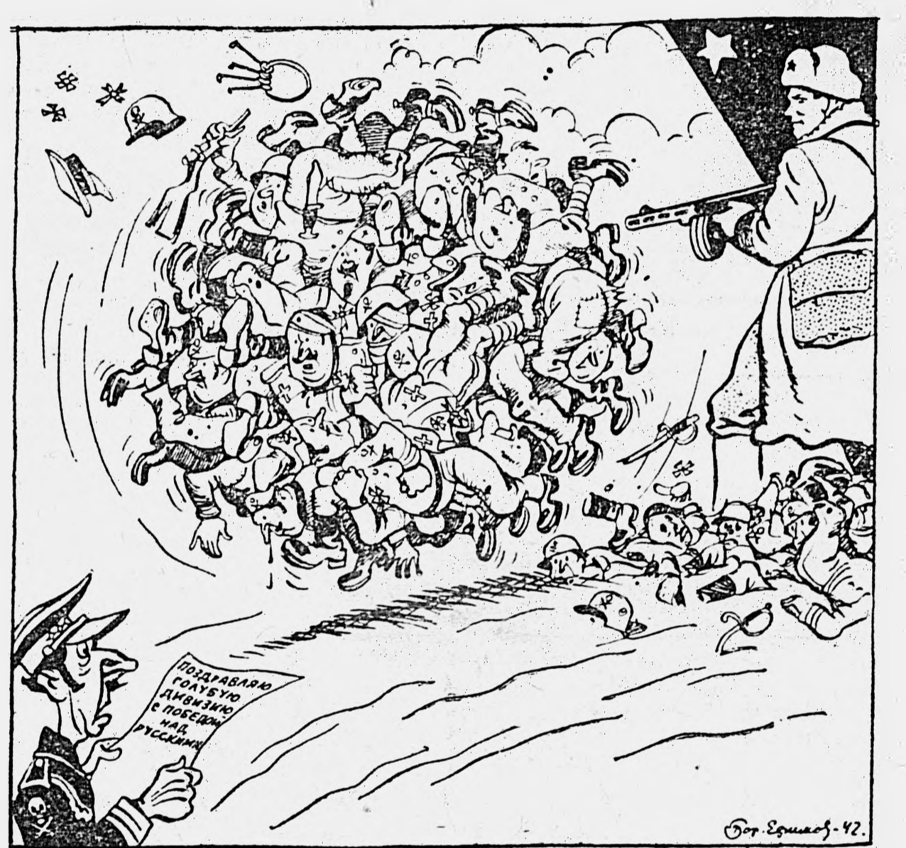
«Голубая дивизия» принимает поздравления.

«КРУТИТСЯ, ВЕРТИТСЯ ШАР ГОЛУБОЙ...» Испанский генерал Мунос Гранде поздравил с победой испанскую «голубую дивизию», наголову разбитую немцами в декабре.