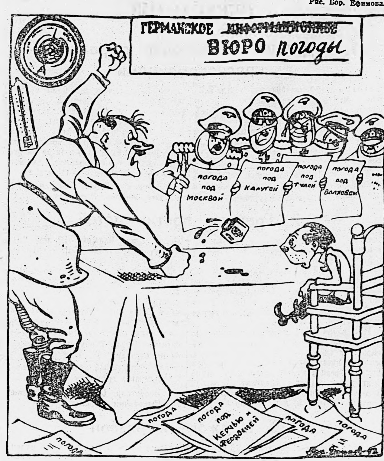
ФЮРЕР.—Приказываю считать отныне Крым ледниковой зоной!!!