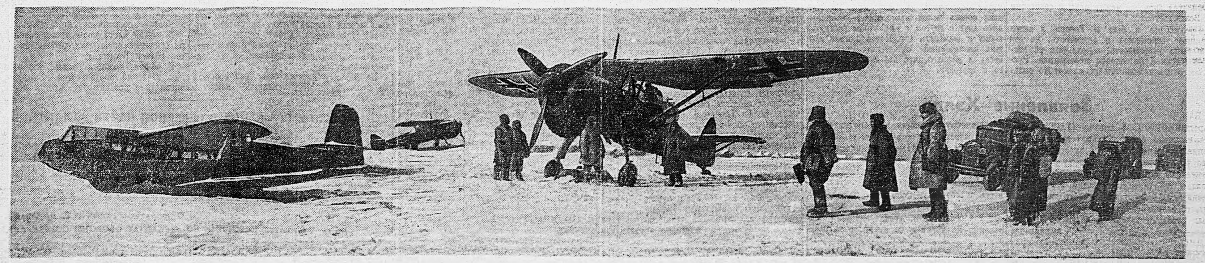
Западный фронт. На снимке: немецкие самолеты и планер (слева), брошенные фашистами при бегстве из гор. Боровска. Справа движется автомашинный с вахаческими частями трофеями во время боя у гор. Боровска.