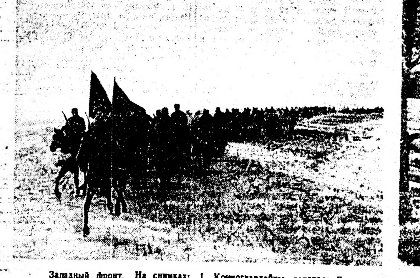
Западный фронт. На снимках: 1. Командир полка генерал Белова на марше. 2. Гвардейцы-автоматчики генерала Белобородова «процессывают» лес.

ЛЕНИНГРАД, 2 января. (По телефону от наш. спец. корр.) Вручение орденов и медалей награжденным состоялось в Ленинграде. Вручение орденов и медалей состоялось в Ленинграде.