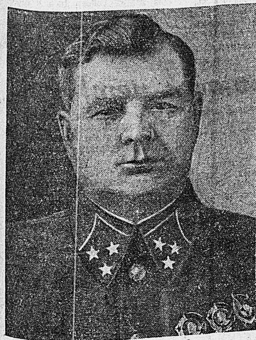
Командующий Кавказским фронтом генерал-лейтенант Д. Т. Козлов.