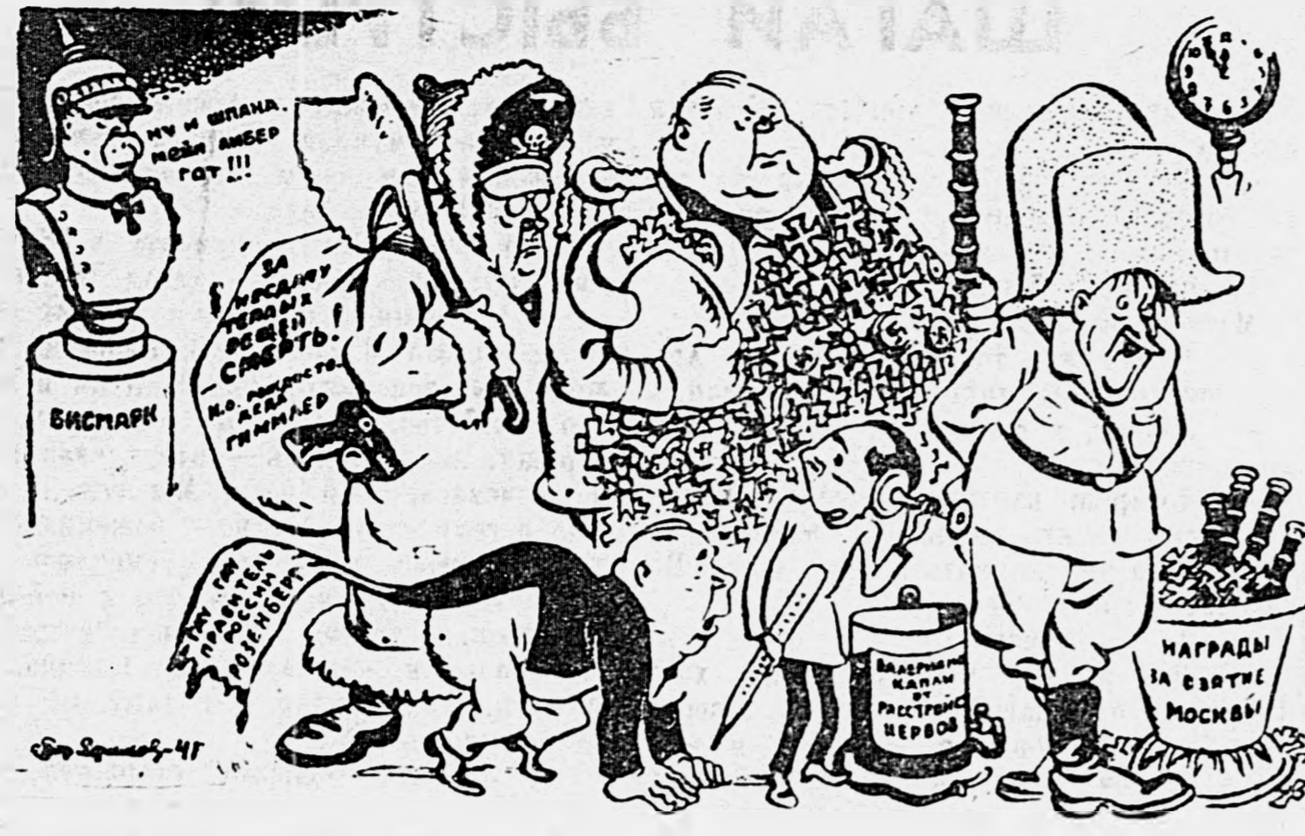
Новогодний парад в Берлине