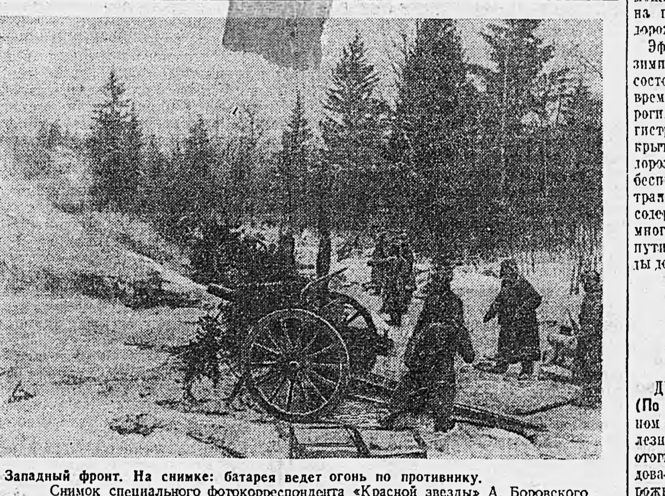
Зимний фронт. На снимке: батарея ведет огонь по противнику.