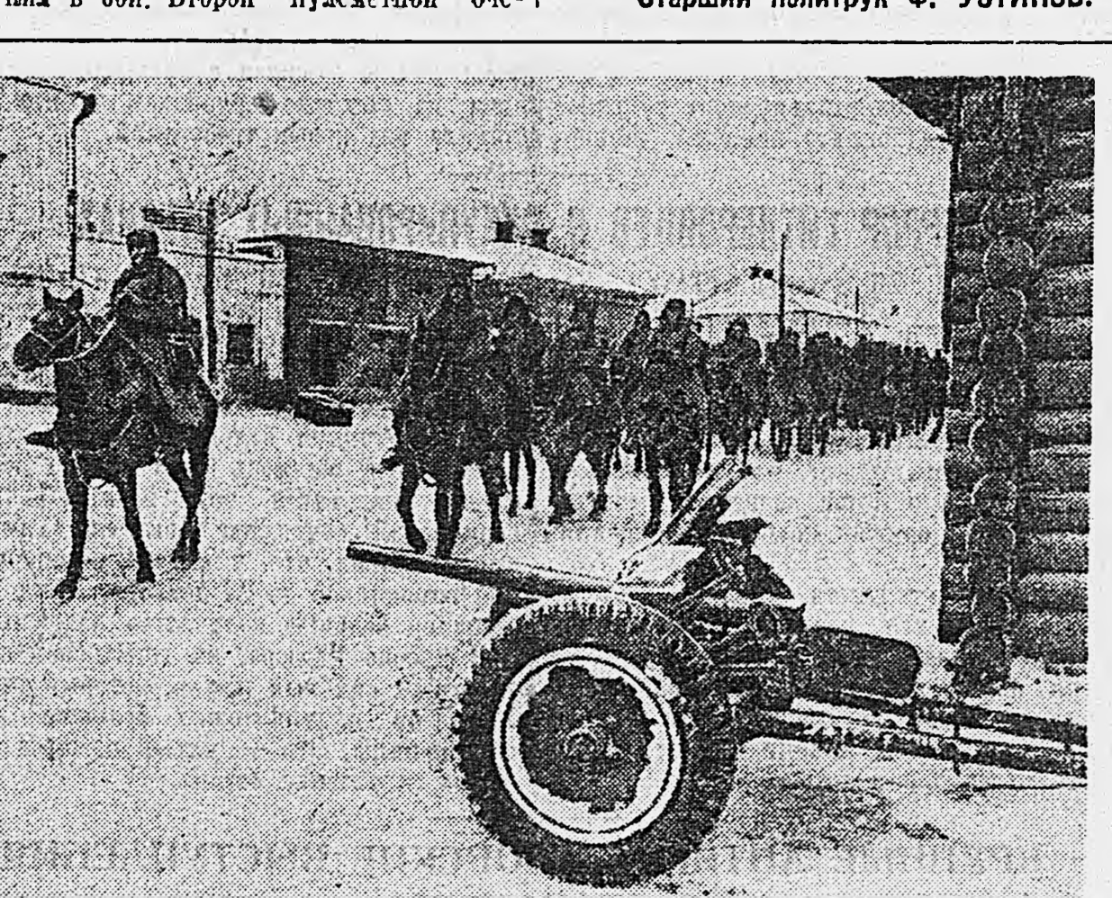
Западный фронт. На снимке: гвардейцы входят в город Олесово, отбитый у немцев.

Батальонный комиссар Горшков, патрулируя в воздухе, встретился с тремя «Мессершмитт-109». Несмотря на численное превосходство противника, он вступил в бой. Второй пулеметный оче-