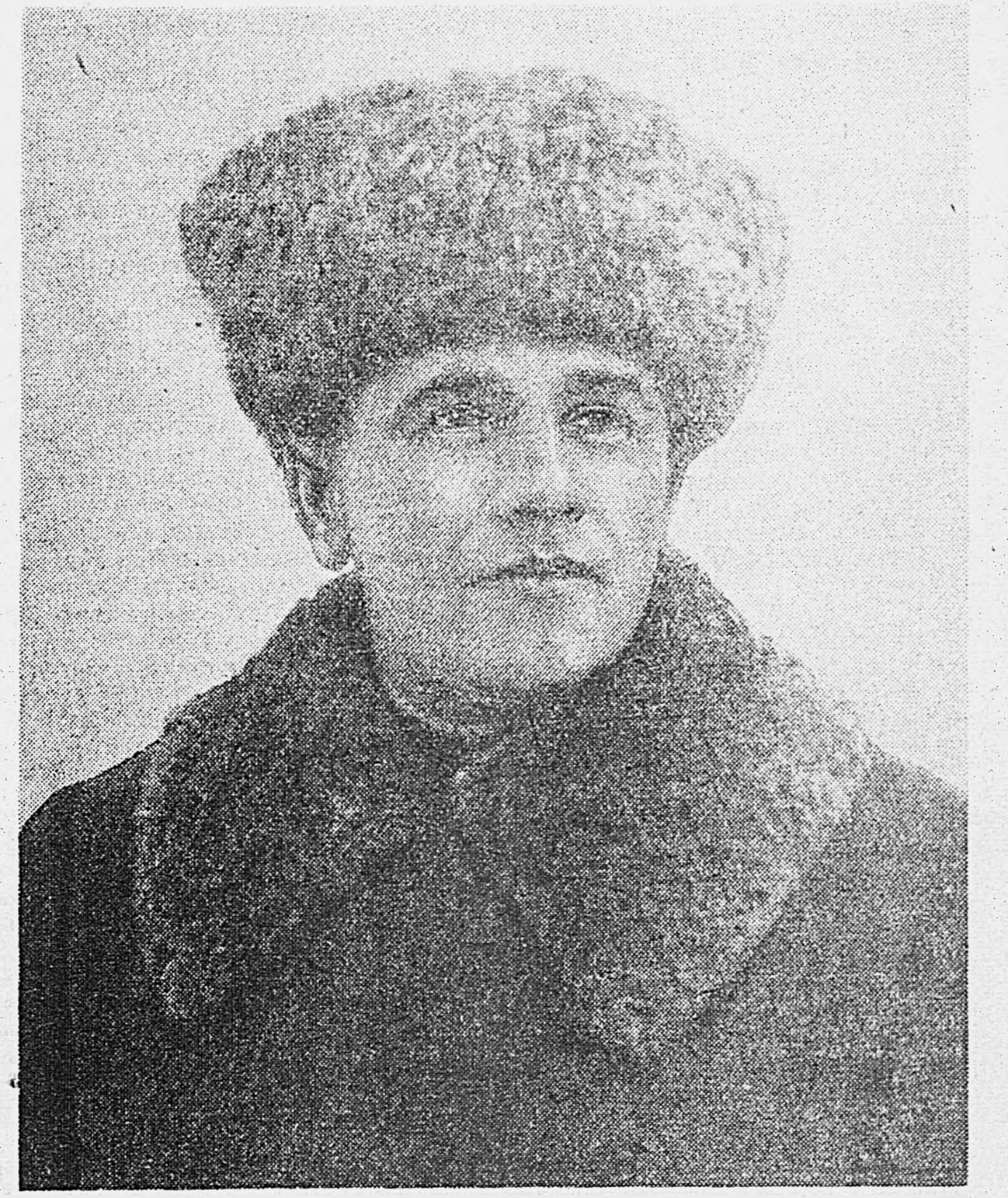
Герой Советского Союза генерал-майор Л. М. ДОВАТОР.

Усилить наступательную активность наших войск. Сильнее нажим на оккупантов! Не давать врагу закрепиться на новых рубежах, бить его без передышки, преследовать неотступно!