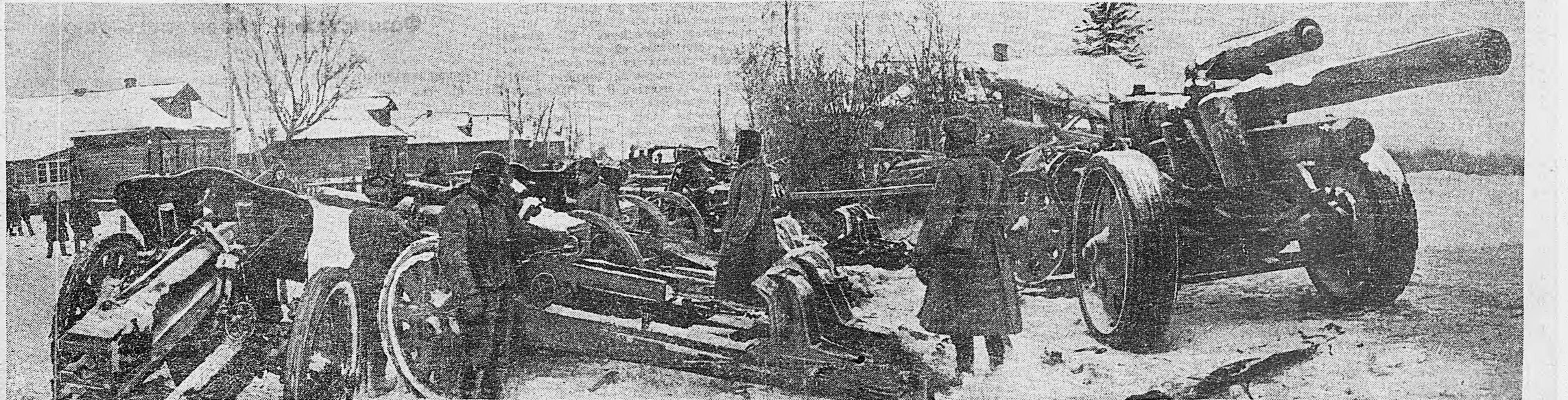
Западный фронт. На снимке: орудия, захваченные нашими войсками при отступлении немцев в районе Волоколамска.