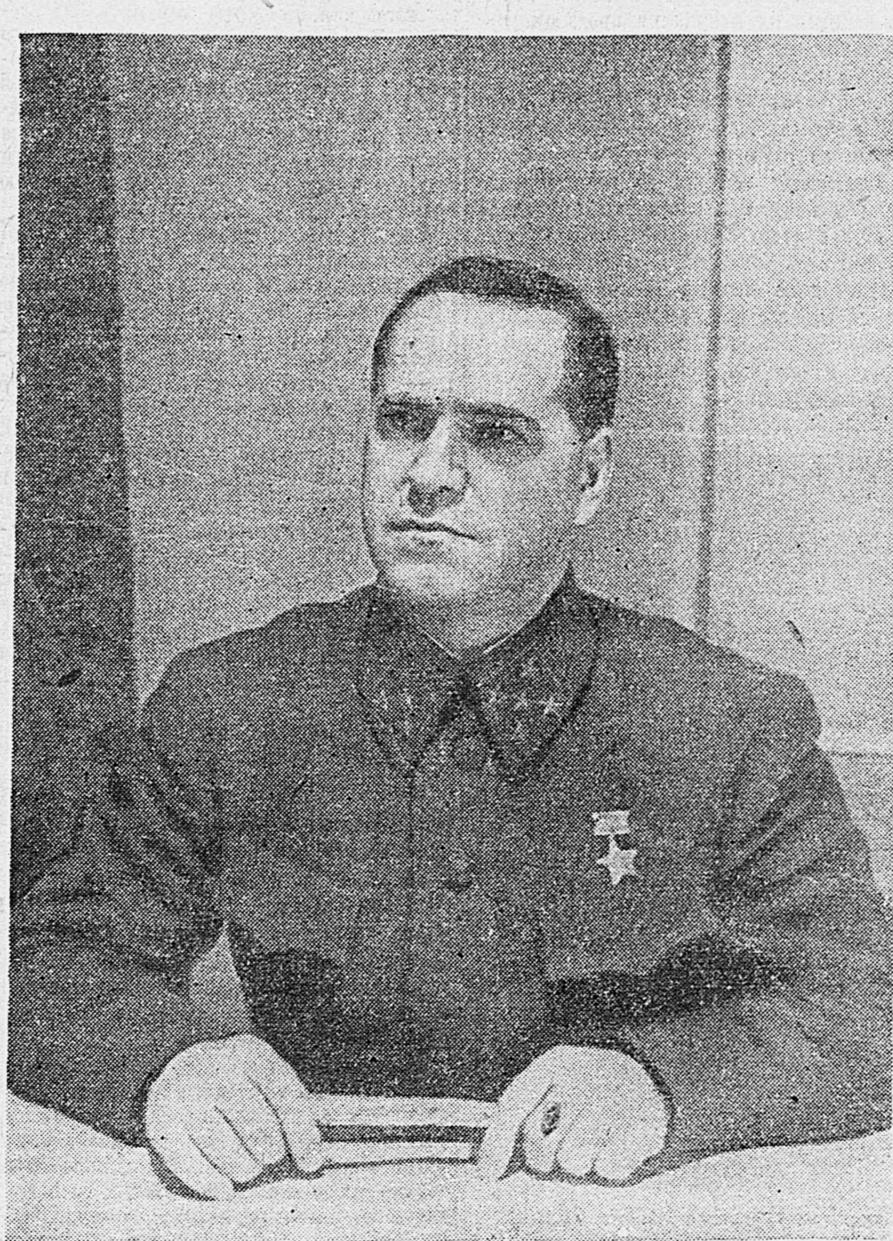
Командующий Западным фронтом генерал армии Г. К. Жуков.