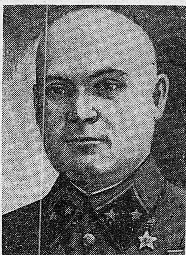
Генерал-майор Д. Д. Лелюшенко