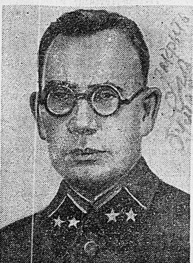
Генерал-майор А. А. Власов