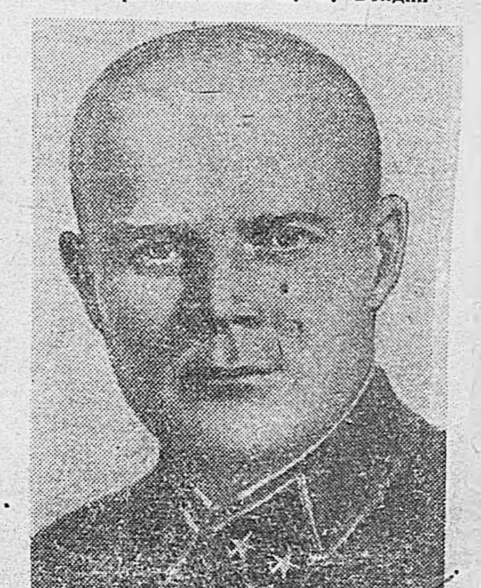
Генерал-лейтенант Ф. Н. Голиков