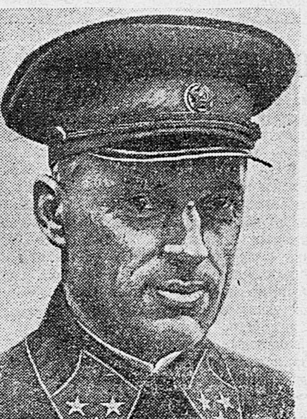
Генерал-лейтенант К. К. Рокоссовский