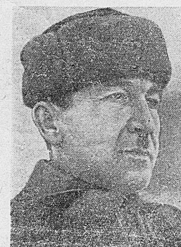
Генерал-майор П. А. Белов