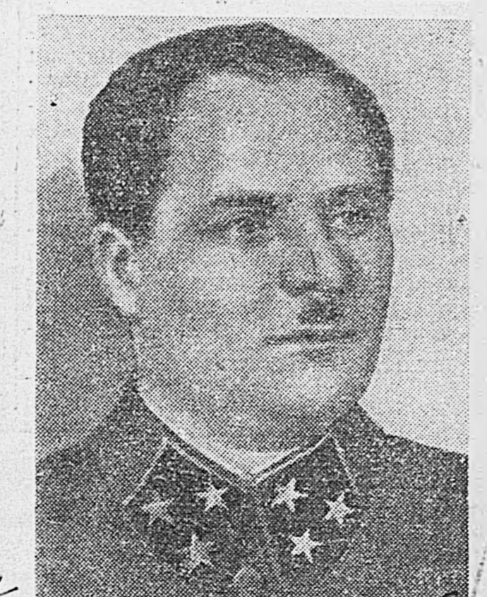
Генерал-лейтенант И. В. Болдин