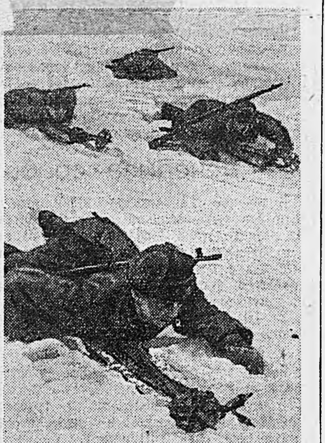
Ленинградский фронт. На снимках: 1. Отделение автоматчиков сержанта Л. Творожникова отправляется в разведку. 2. Бойцы зам. политрука М. Захарова перемещаются на лыжах к передовым постам противника.