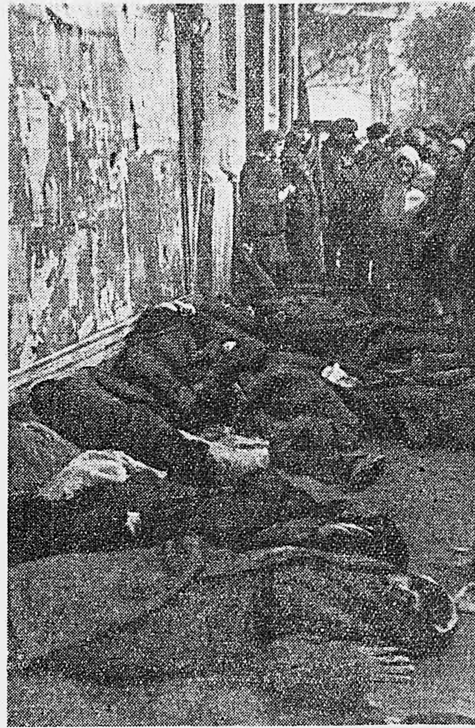
2. На углу Советской и Нольной улиц немецкие мерзавцы расстреляли 26 ростовчан. Они расстреливали всех, кто попался под руки, — стариков, женщин, детей.