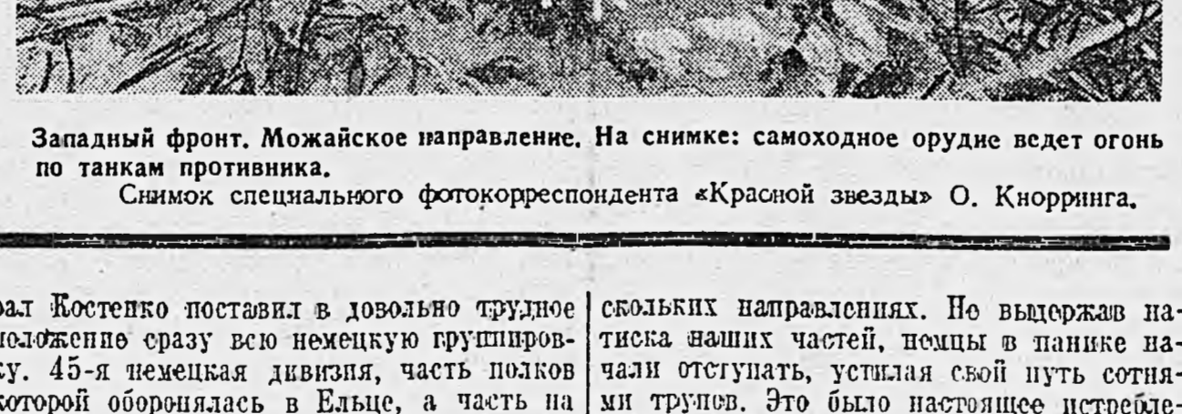
Западный фронт. Можайское направление. На снимке: самоходное орудие ведет огонь по танкам противника.

Румынские временщики беспечно борются с эпидемией, которую распространяют их обессиленные войска.