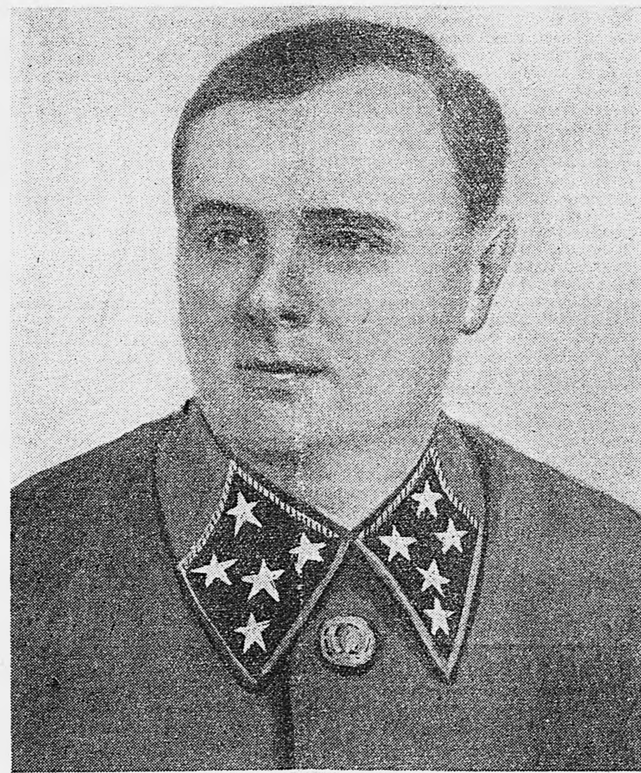
Генерал армии К. А. Мерцков.