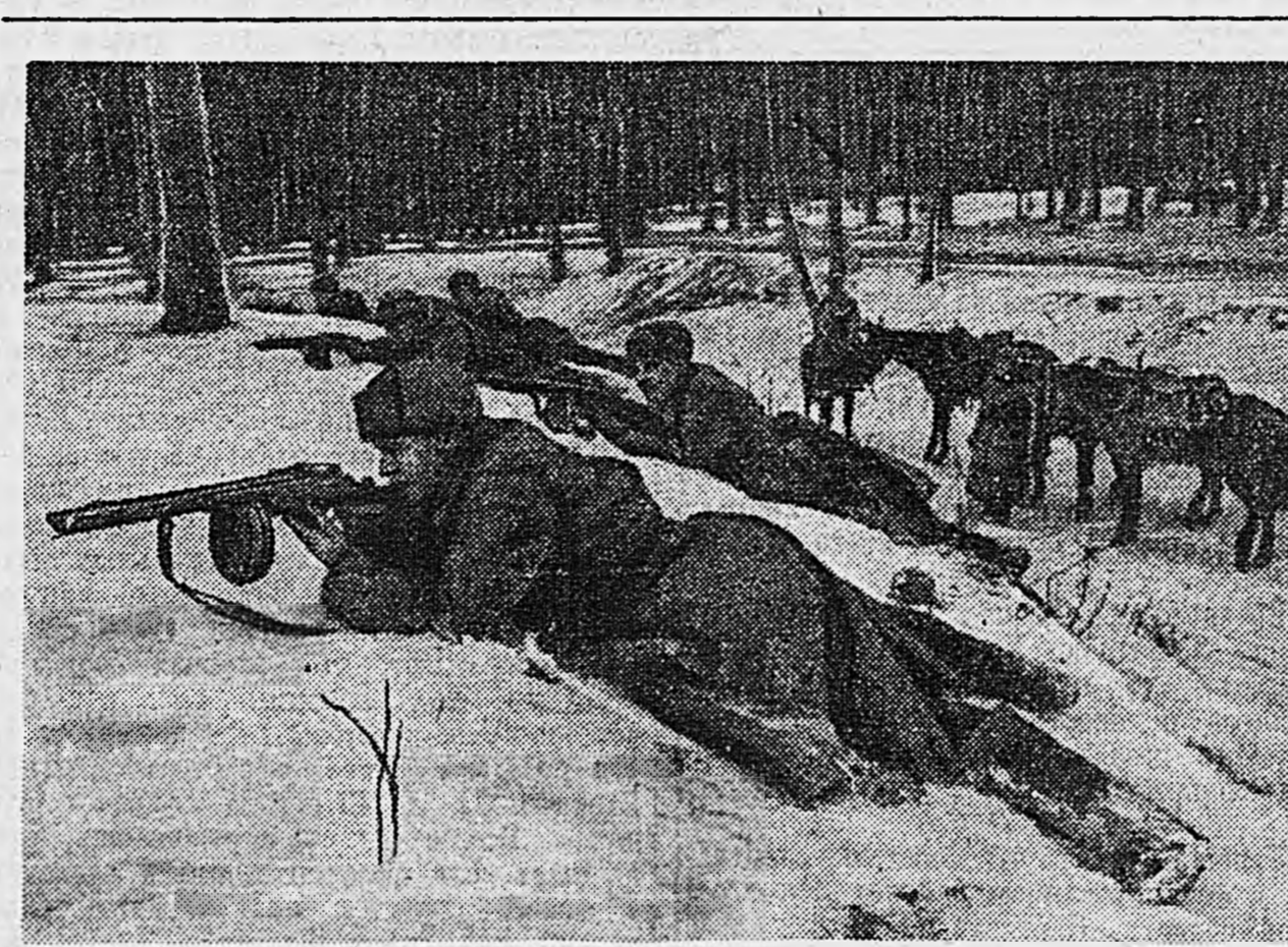
Западный фронт. На снимке: коники-автоматчики 1-го гвардейского кавалерийского корпуса ведут огонь по противнику.

На одном из участков фашисты оказывали особенно упорное сопротивление. Тогда в часть темной ночью незаметно подошла к населенному пункту, в котором немцы создали сильную оборону. Бойцы стремительно атаковали неприятеля. Опе-