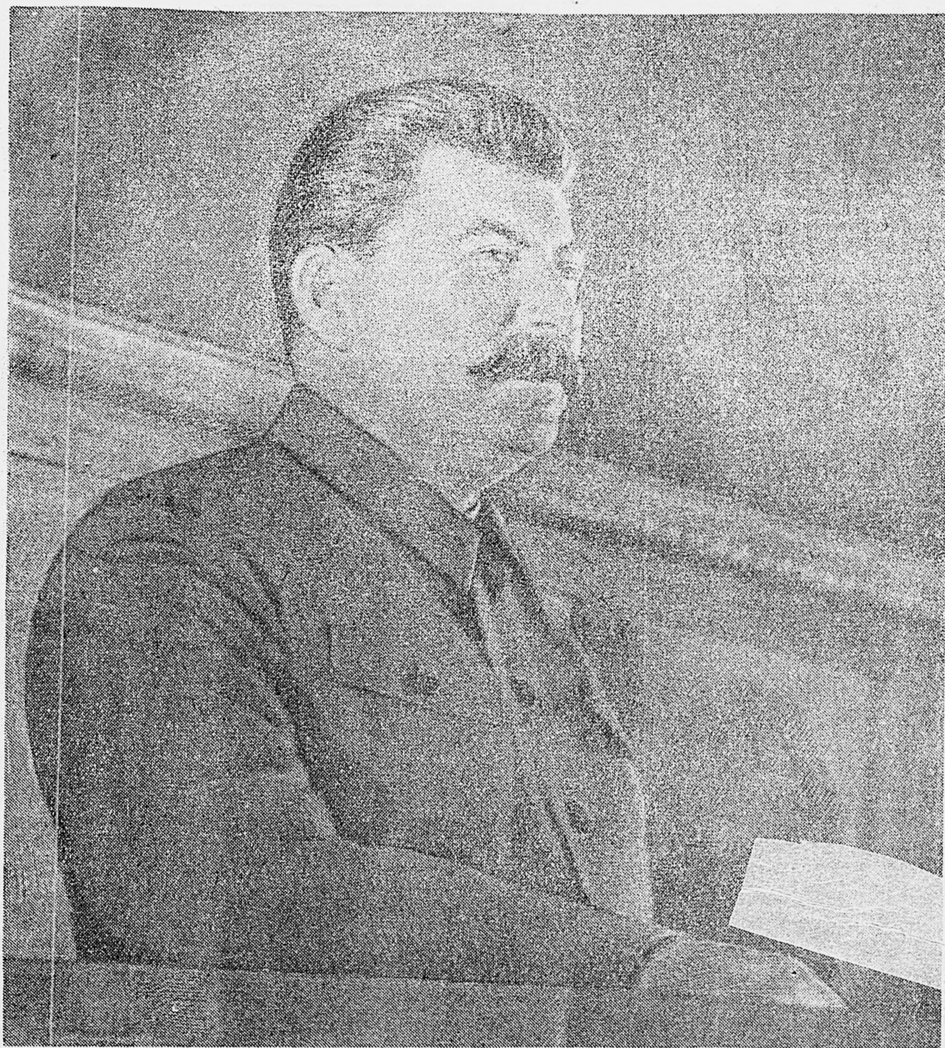
Товарищ И. В. Сталин на трибуне Чрезвычайного VIII Всесоюзного Съезда Советов. 5 декабря 1936 года.