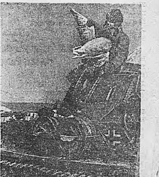
(Снимки доставлены на самолете).