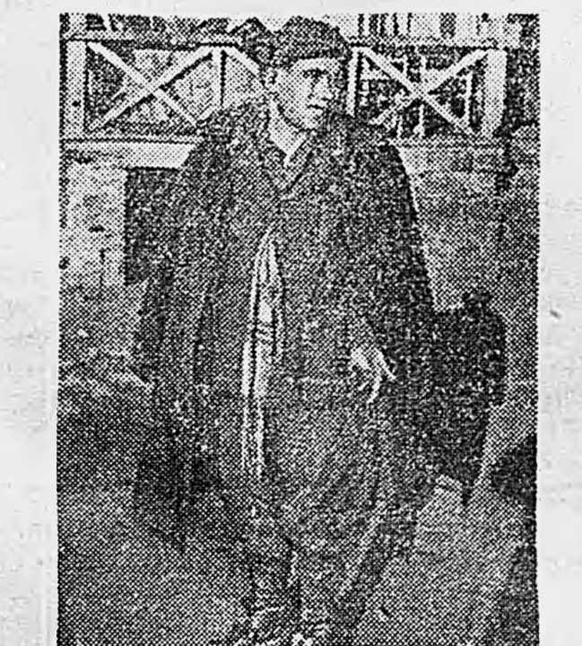
Южный фронт. На снимке: 1. Итальянский солдат образца ноября 1941 года — захваченный нами бойцами обнаружил украинского колхозника гуса. Внутри одного из танков наши бойцы обнаружили украинского колхозника гуса.

Придется и 1-ю гвардейскую дивизию и другие дивизии переиспыт в список «за здравие». А «за упокой» переиспыт немецкие дивизии, разбитые по Ростове. Д. ЗАСЛАВСКИЙ.