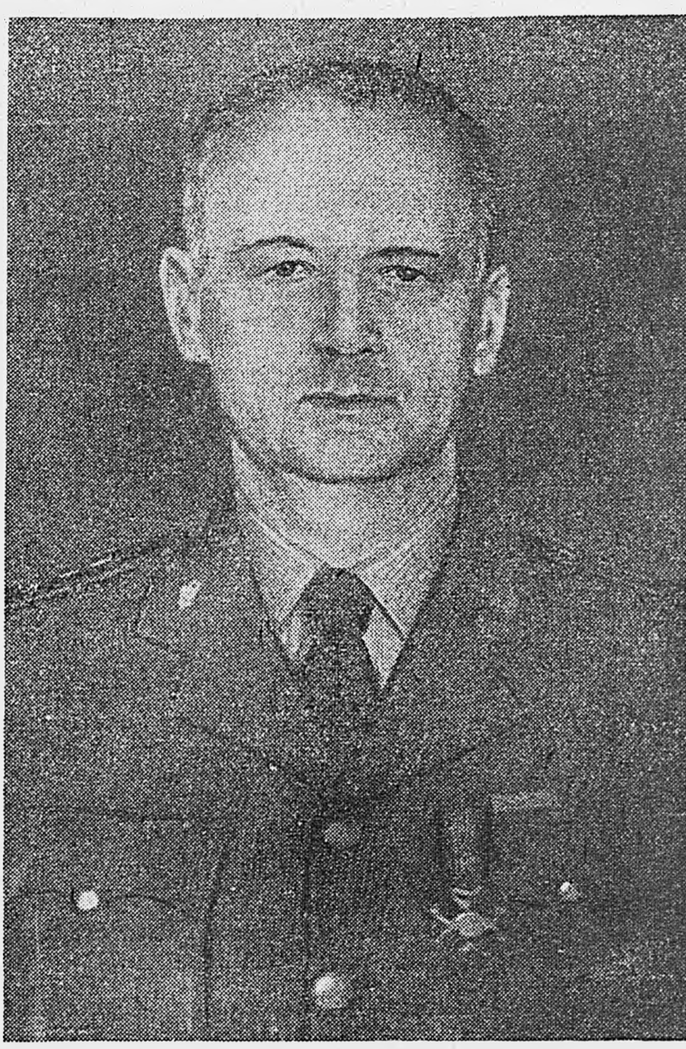
Председатель Совета Министров Польской Республики генерал Вл. СИКОРСКИЙ.