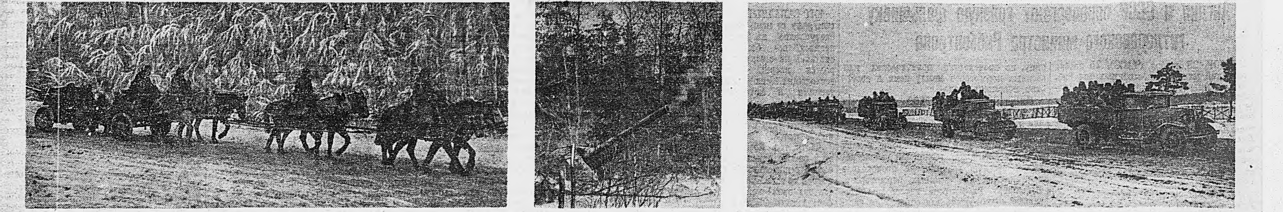
Западный фронт. Можайское направление. На снимках: 1. Артиллерия движется на огневые позиции. 2. Тяжелое орудие подразделения младшего лейтенанта П. Синецкого ведет огонь по противнику. 3. Мотомехпехота направляется к месту боевых действий.