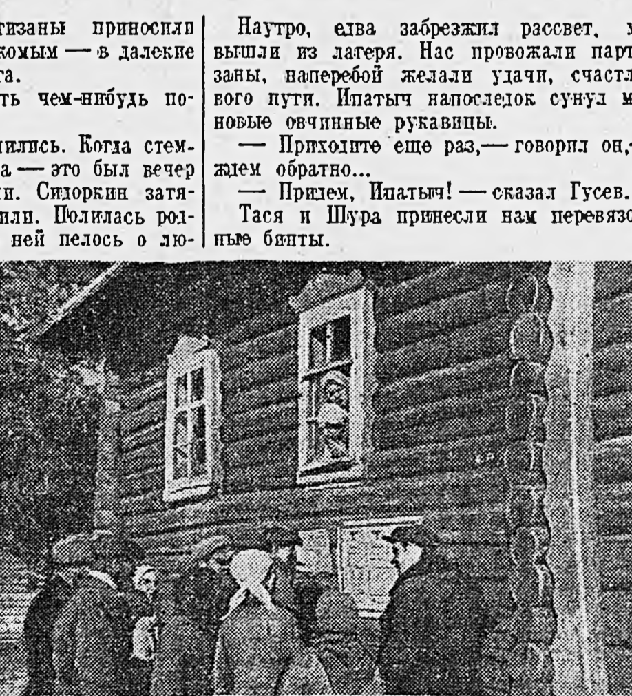
...На стене хаты висело объявление на русском и немецком языках.