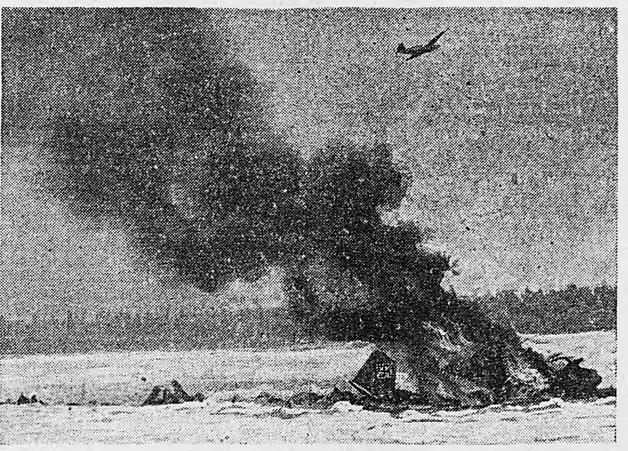
Западный фронт. Сталиногорское направление. На снимке: фашистский бомбардировщик, сбитый нашими истребителями.

Орден Трудового Красного Знамени награждено 29 человек; Орден Красной Звезды награжден 21 человек; Орден «Знак Почета» награждено 122 человека; Медаль «За трудовую доблесть» награждено 124 человека; Медаль «За трудовые отличия» награждено 43 человека. (ТСС)