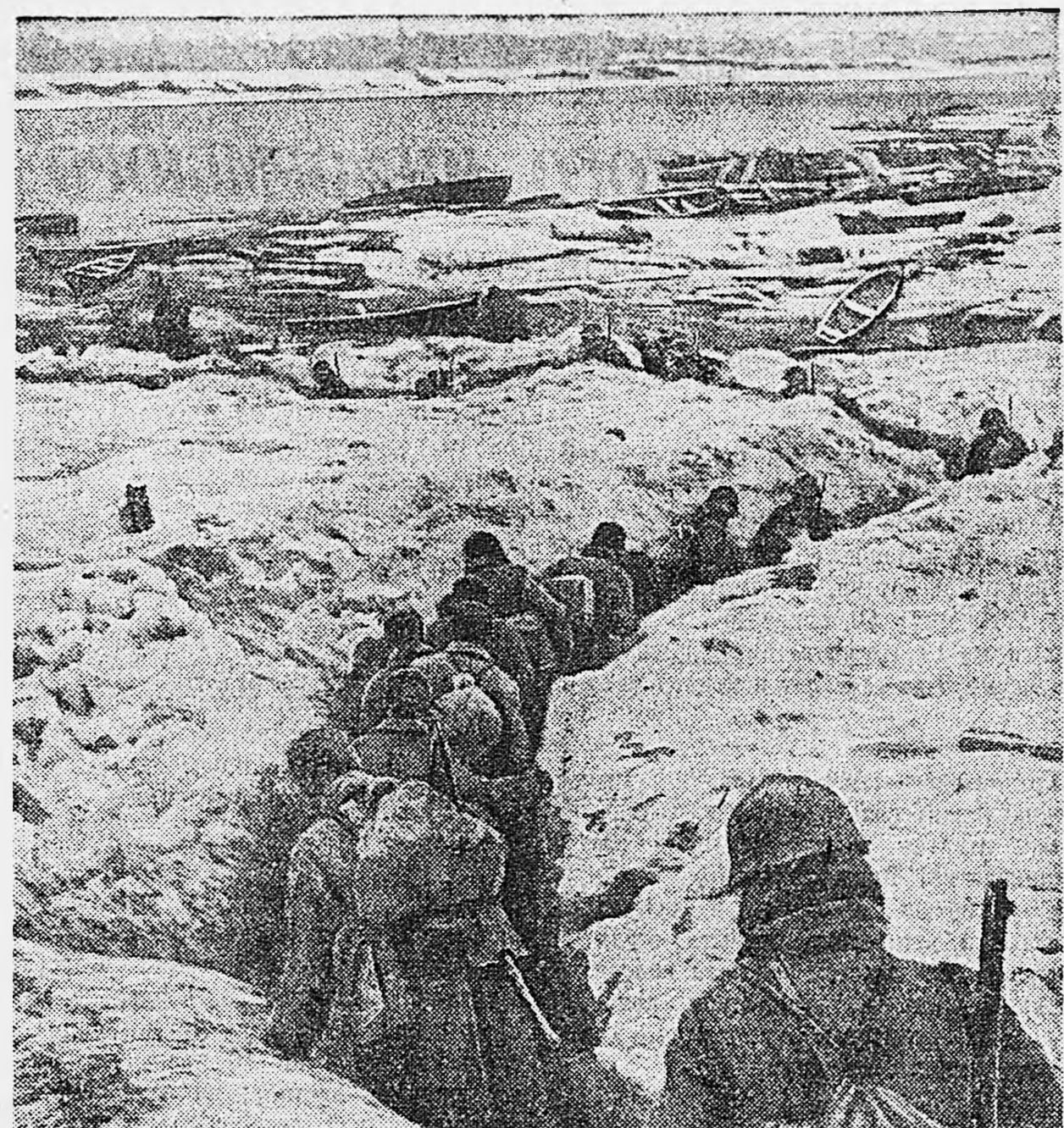
Оборона Ленинграда. На снимке: бойцы по ходу сообщения движутся к переправе.