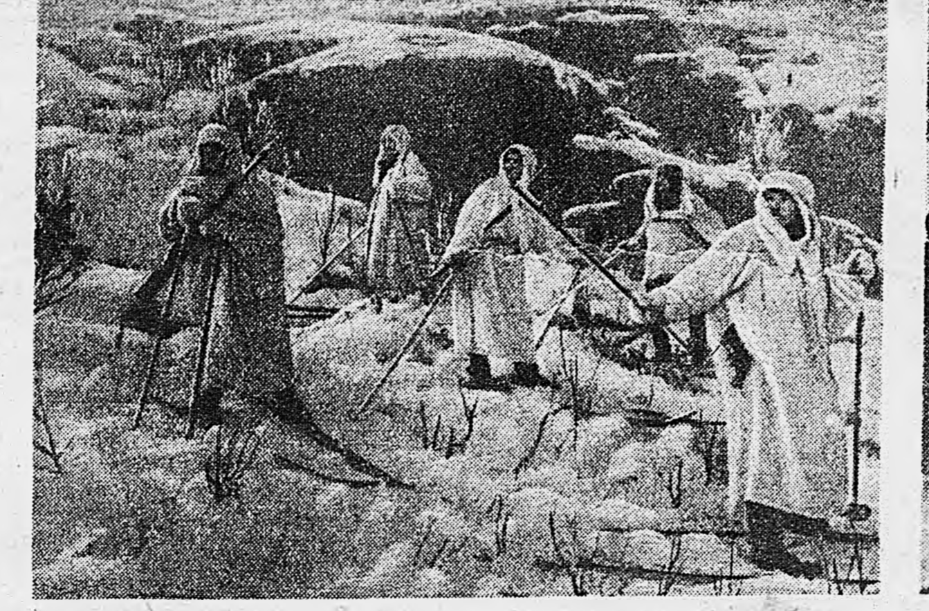
СЕВЕРНЫЙ ФРОНТ. На снимках: 1. Отделение ведет наблюдение за местностью. 2. Пулеметный расчет на огневой позиции.

Почти ежедневно наши наступающие части находят в лесах и на поле обмороженных немцев. Мы уже сообщали, что вчера были найдены 7 трупов. Сегодня только в одном лесу красноармейцы X части нашли обмороженных и оказавшихся 12 немецких солдат. Все они одеты по-летнему, в пижамках, в зеленых куртках. Русская зима уже дает себя знать. А ведь настоящие крепкие морозы впереди! На южной окраине Тулы — поиски разведчиков и артиллерийская перестрелка. На юго-востоке от города немцы продолжают концентрацию танков, пехоты и артиллерии.