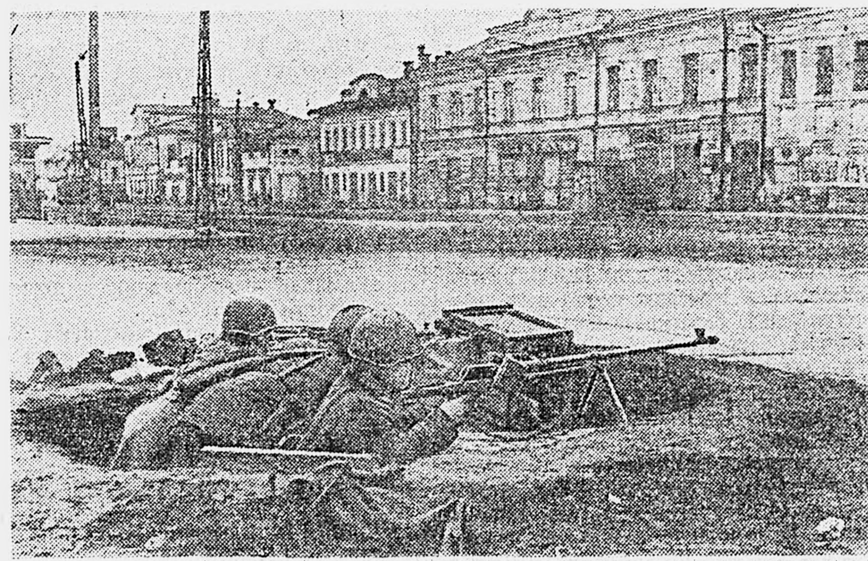
Оборона Тулы. На снимке: бойцы приготовились вести огонь из противотанкового ружья по фашистским танкам.