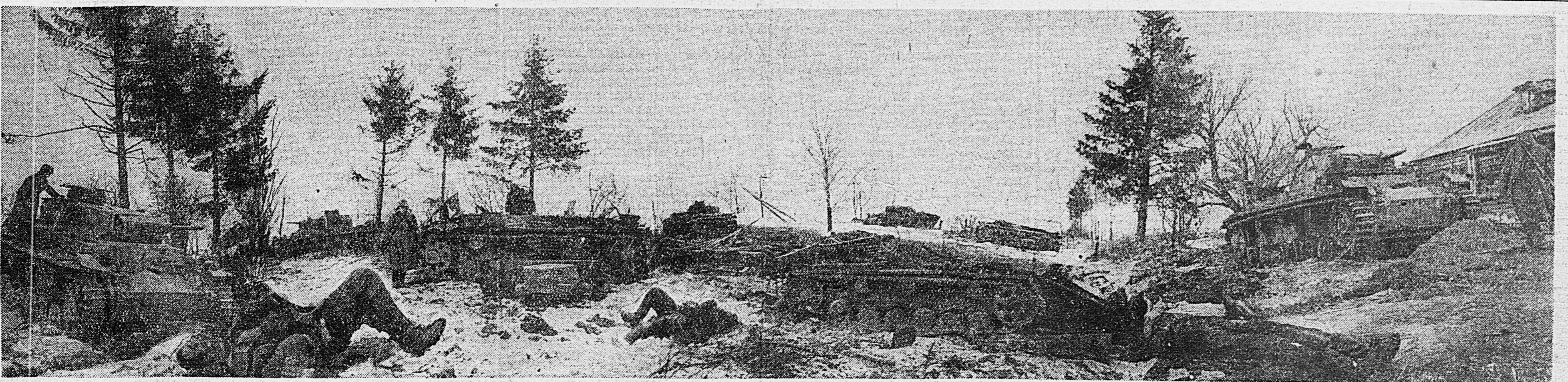
Волоколамское направление. На снимке: немецкие танки, подбитые и захваченные 1-й Гвардейской танковой бригадой в боях 13 ноября.

С каждым днем в наших полках и дивизиях растет количество советских автоматчиков. Они снабжены замечательными советскими автоматами, которые далеко превосходят немецкие автоматы. Пройдет немного времени и превосходство немцев в автоматах будет сведено к нулю. Приказ наркома обороны товарища Сталина о создании во всех полках мощных отрядов автоматчиков будет выполнен.