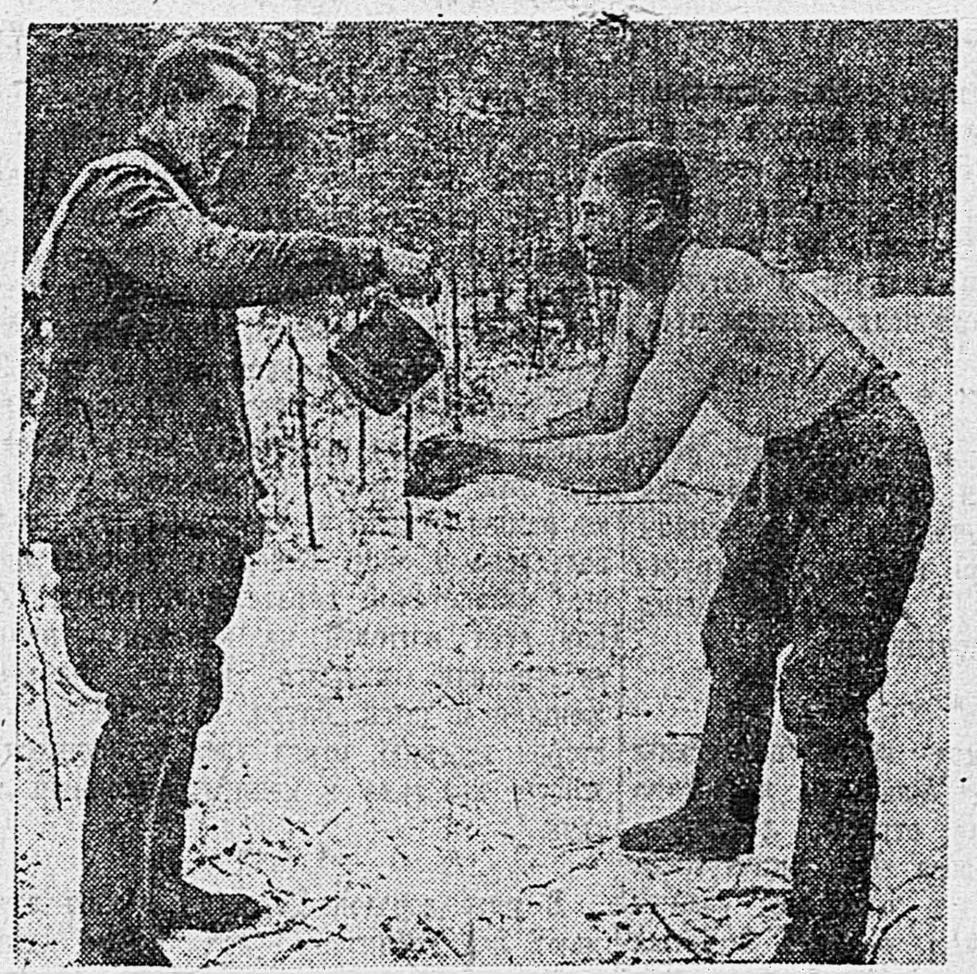
Приходит настоящая русская зима, с морозами, ветрами и выгогой. Наши люди привыкли к ней с малости, как их отцы и деды. Скинув гимнастерку, боец умывается в лесу и улыбка бодрости не сходит с его лица. Посмотрите на другой снимок. Только что захваченные в плен гитлеровские молочники надели на себя шарфы и кашаевки. Они едят на морозе и имеют жалкий вид. Зима берет за горло фашистов. Действительно, что русскому здоровью, то немцу смерти!

На новом рубеже бой продолжается с переменным успехом.