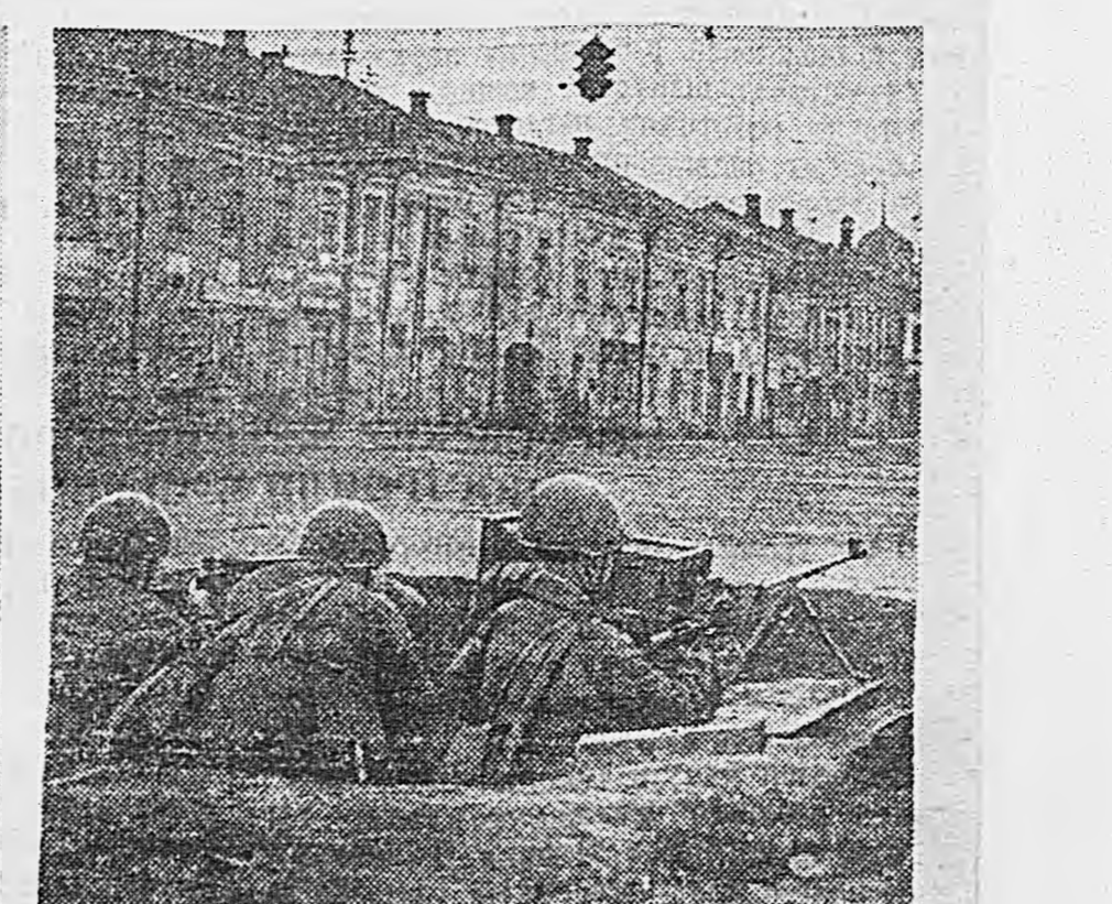
Оборона Тулы. На снимках: 1. Рабочий полк идет на позиции. 2. Батарея старшего лейтенанта Щербакова, уничтожившая в один день 2 самолета противника. 3. Орудие, установленное на одном из городских мостов. 4. Окопы на улице Коммунаров.