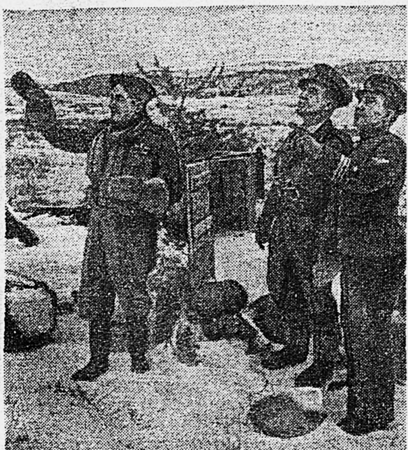
Северный фронт. На снимках: охраняют командный пункт.