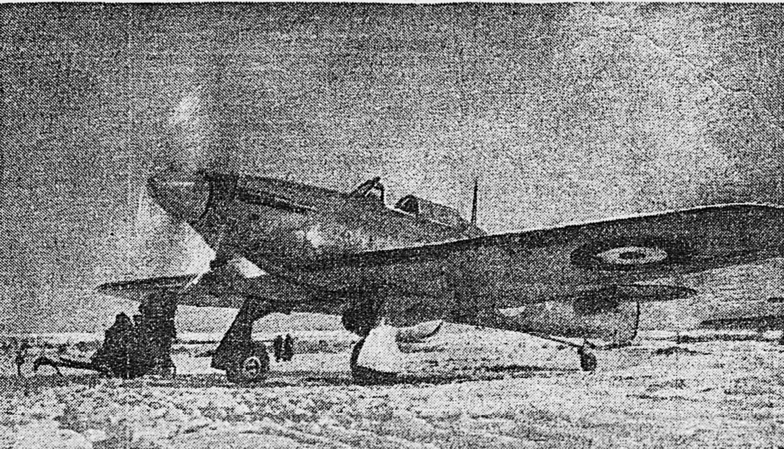
1. Английские летчики — капитан Г.Коттен, подполковник Невиль Ишервуд и советский летчик капитан В. Андруши на командном пункте. 2. Английские самолеты на старте. 3. Английские солдаты.