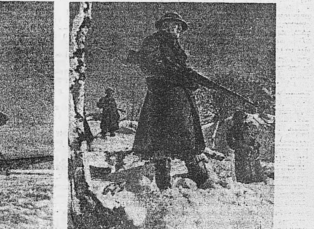
Снимки специального фотоаппарата «Красная звезда» М. Берштейна.