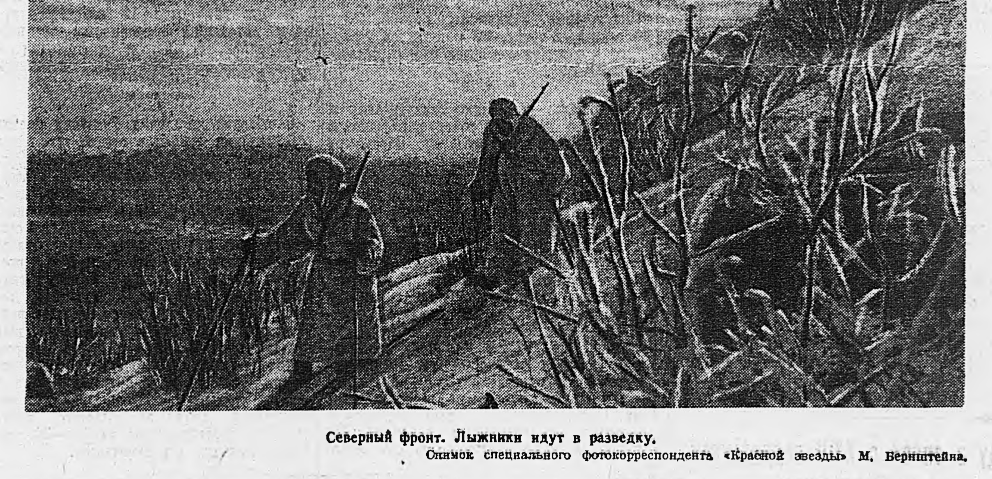
Северный фронт. Лыжники идут в разведку.

В один из пасмурных дней лейтенант Курпиров вылетел на разведку. Установив наличие вражеской танковой колонны, действующей в пункте Н, он стал возвращаться на свой аэродром.