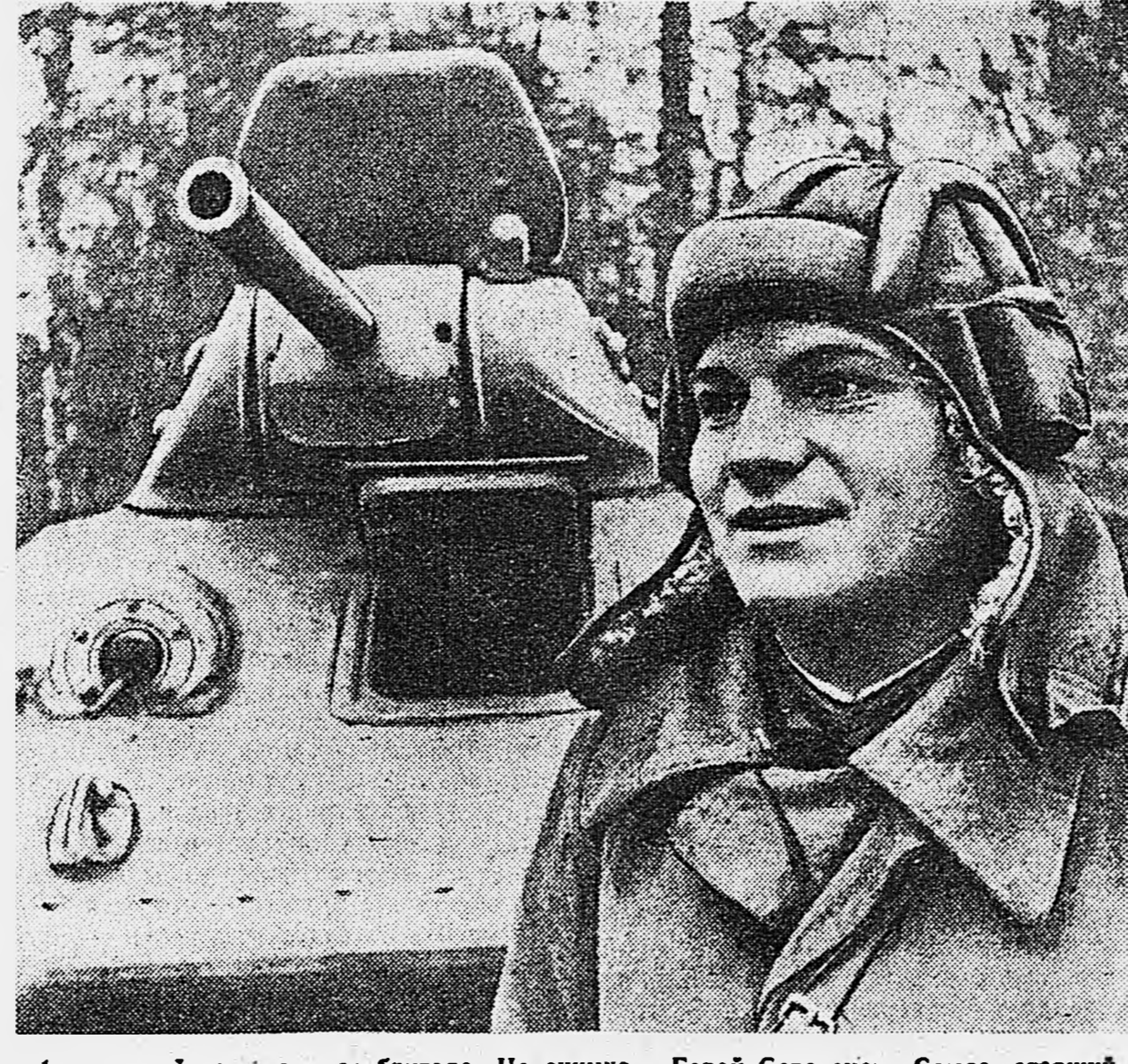
1-я гвардейская танковая бригада. На снимке — Герой Советского Союза старший сержант И. Любушкин.