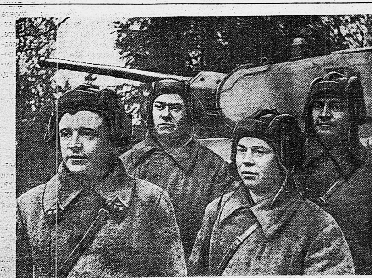
1-я гвардейская танковая бригада. На снимках: 1. Командир танка лейтенант