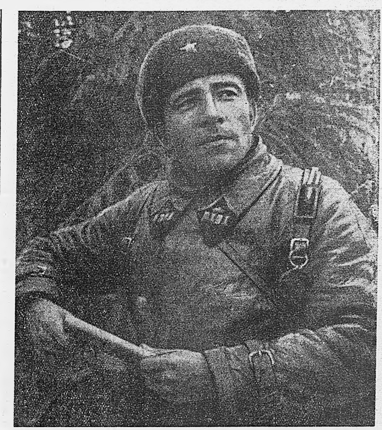
Командир 1-й гвардейской танковой бригады генерал-майор танковых войск М. Е. Катюков.

Немецкие солдаты и офицеры, захваченные в плен на Южном фронте, рассказывают, что германские войска несут огромные потери в технике и живой силе. Пленный немецкий лейтенант Рудольф Бауле заявил: «В 9 немецкой танковой дивизии из 140 танков уцелело не больше 50 машин. В каждом полку потери уни-