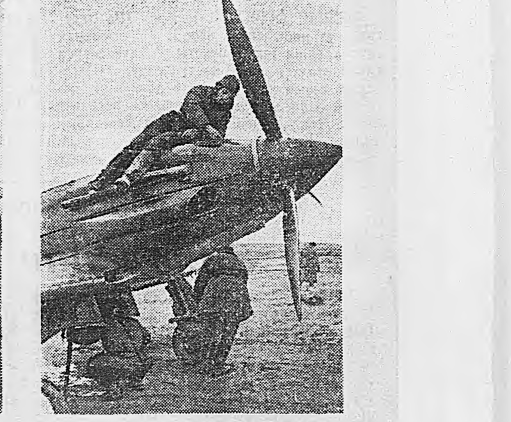
Оборона Москвы. Несколько дней тому назад Указом Президиума Верховного Совета СССР присвоено звание Героя Советского Союза лейтенанту Катричу. На снимках (слева направо): 1. Герой Советского Союза Катрич перед взлетом. 2. Самолет вырывается на старт. 3. После полета. 4. Подготовка машины к очередному вылету.