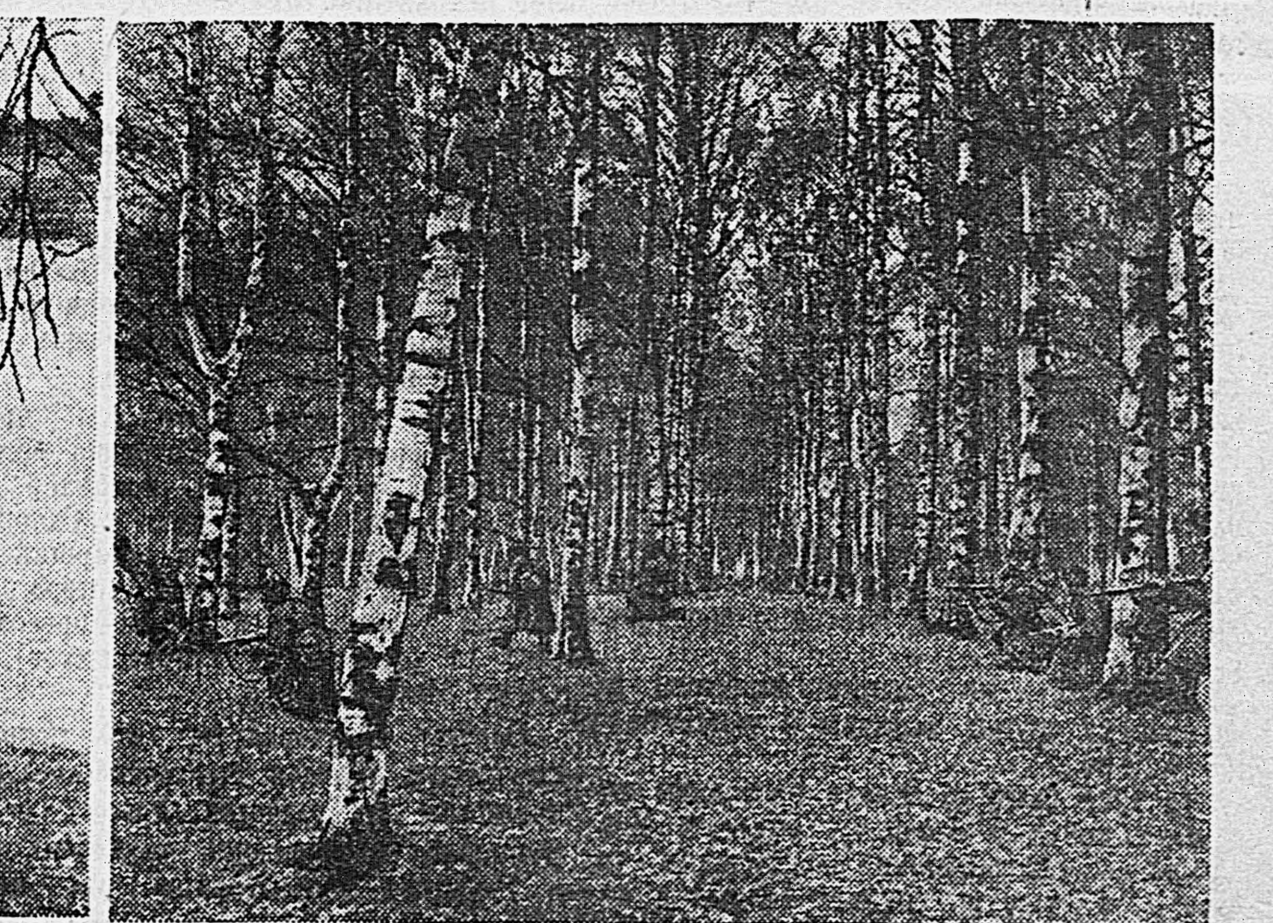
Калининское направление. На снимках (слева направо): 1. Бойцы Н части в обороне. 2. В дозоре. 3. Отделение выдвигается в разведку.