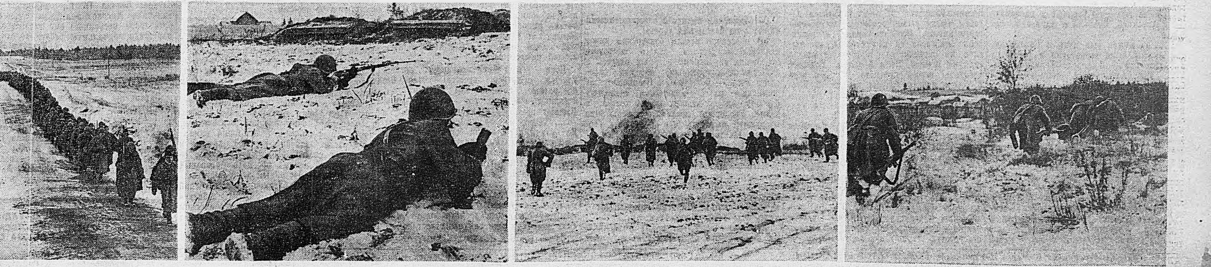
Северо-западное направление. На снимках (слева направо): 1. Новые резервы подтягиваются к передовым позициям. 2. Перед атакой. 3. Бойцы N части преследуют отступающего врага. 4. Пулеметчики передвигаются на новый огневой рубеж.