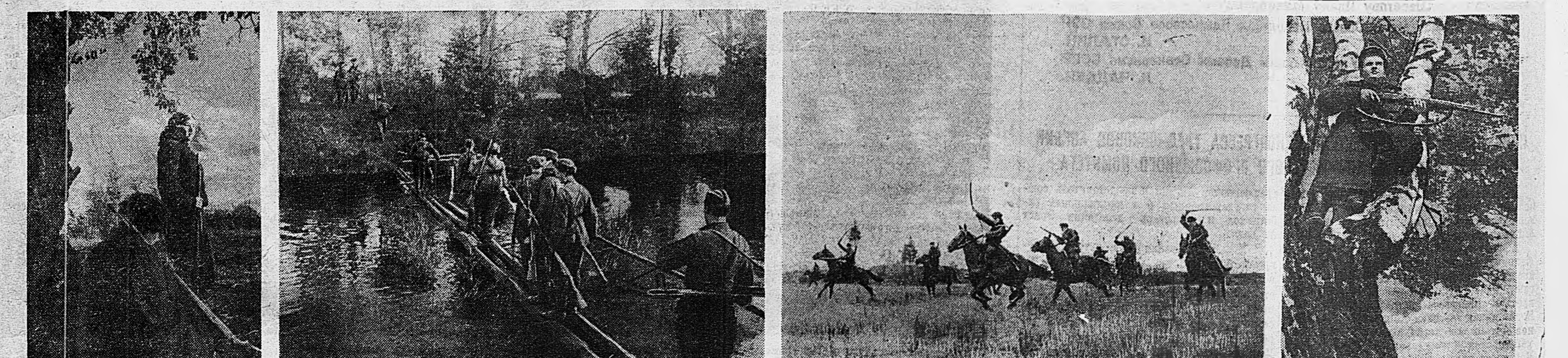
В партизанском отряде «Грозный». На снимках (слева направо): 1. Девушки-партизанки у входа в партизанский лагерь. 2. Партизаны направляются на выполнение боевой операции. 3. Группа партизан преследует остатки разгромленной или фашистской колонны. 4. Партизан З. на наблюдательном пункте.

Их судьба сейчас — в твоих руках. Пусть же будет с точностью расщитан Взмах смертельного твоего штыка. Чтобы встали в полный рост колоды, Чтобы не задыхался песок в груди, Сталоискоо клятвой поклянемся. Пусть немцами ордям прегардист. Родина! Ты нам всего дороже. Родина — мой город, отчий дом. Выбора иного быть не может: Смерть Или победа над врагом! Е. ШЕВЕЛОВА.