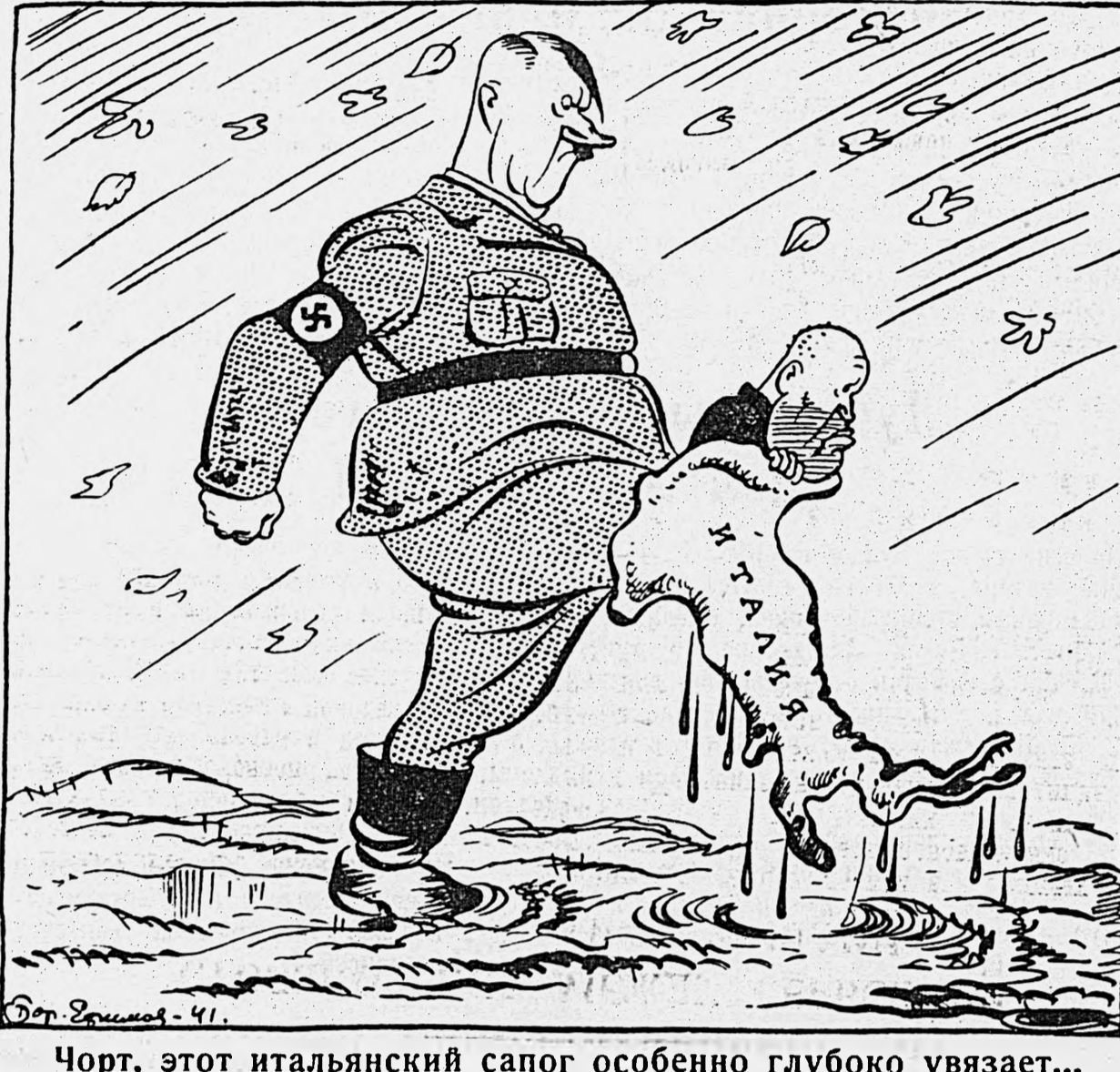
Чорт, этот итальянский сапог особенно глубоко увязает...

Внутриполитическая напряженность в Италии сильно беспокоит Гитлера. Итальянский народ начинает понимать всю нелепость и преступность войны, в которую его втянули Гитлер и Муссолини. Начался процесс глубокого брожения среди народных масс. Итальянский «сапог» начинает болеть жать... (Из газет).