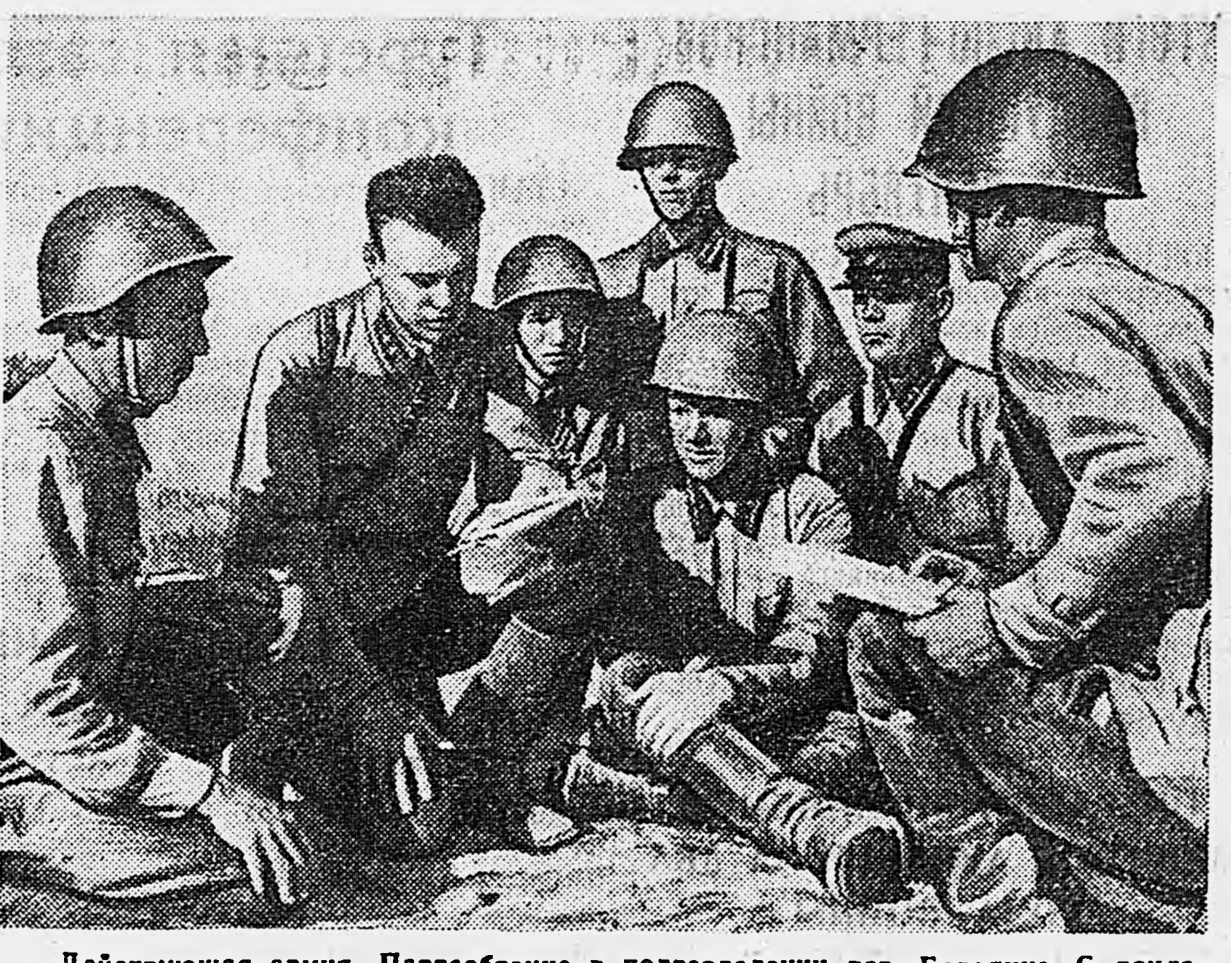
Действующая армия. Партсобрание в подразделении тов. Бородин. С докладом выступает младший политрук тов. Шуца.