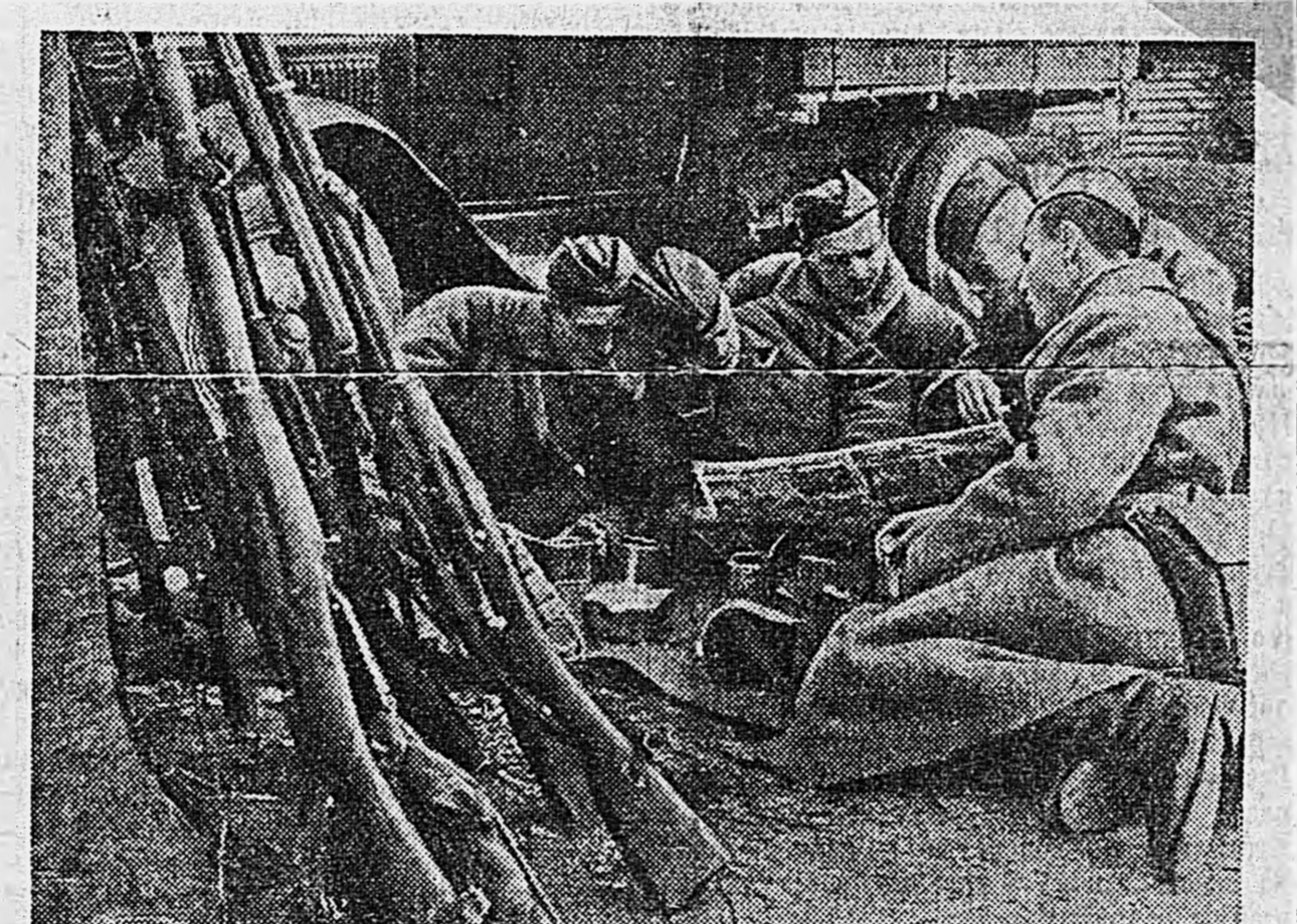
Действующая армия. Бойцы читают журнал «Фронт-иллюстрирте».

Вышел очередной (восьмой) номер фронтовой иллюстрированной газеты для немецких солдат «Фронт-иллюстрирте». Номер содержит ряд снимков, показывающих разгром немецких дивизий под Ельней. В руках Красной армии попадали огромные количества военных трофеев, в том числе много танков. Газета показывает тяжелый немецкий танк «Принц Эйген», на который взорвался советский танкист. Выступил лозунг: «Этому „Принцу Эйгену“ враг ли когда-либо снилось, что он станет трофеем красноармейца, гордого сына русского народа». На другом снимке видны результаты действия советской противотанковой артиллерии. Крупный немецкий танк в не-