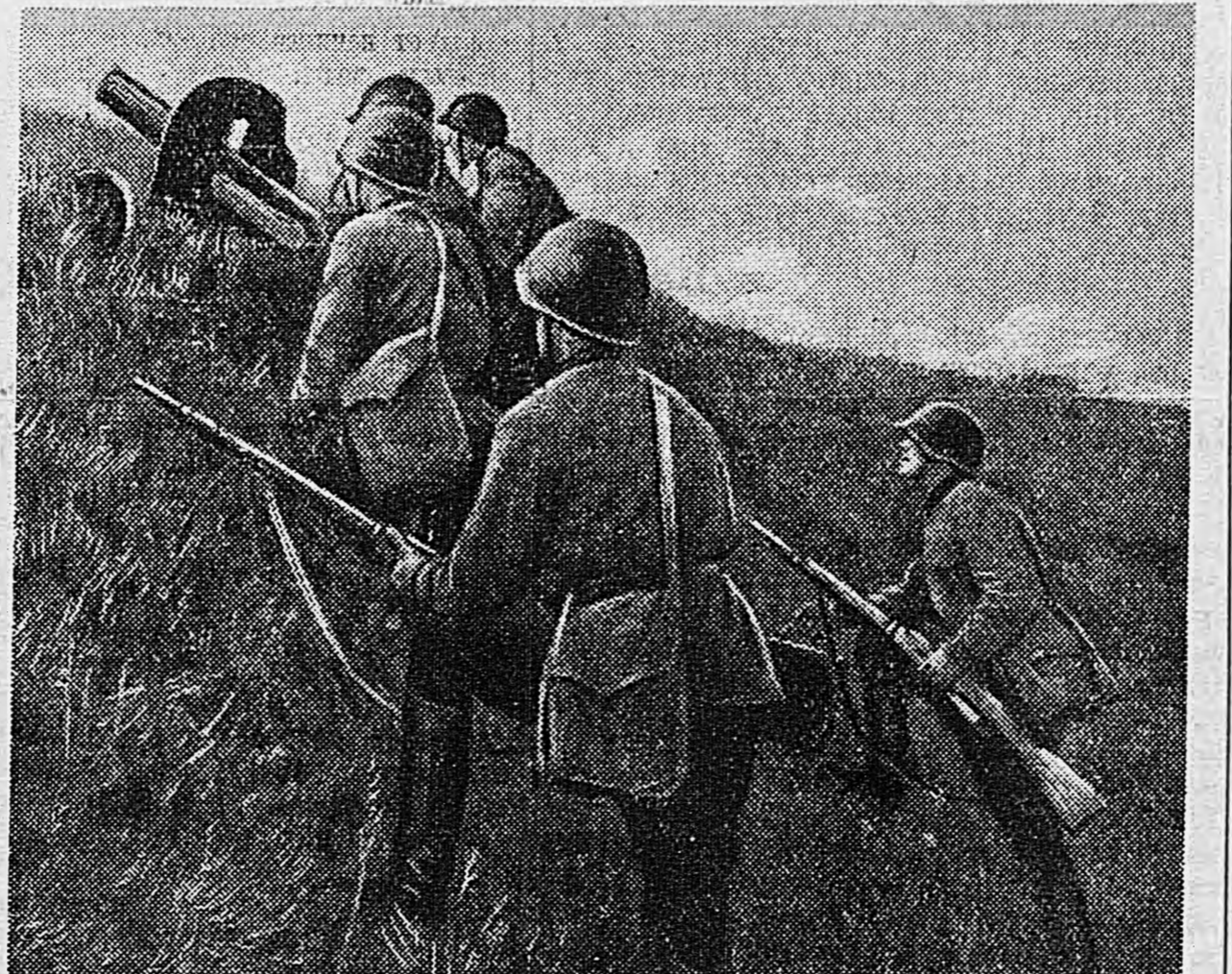
Действующая армия. На снимке: казаки группы генерал-майора Доватора выдвигаются на новый огневой рубеж.