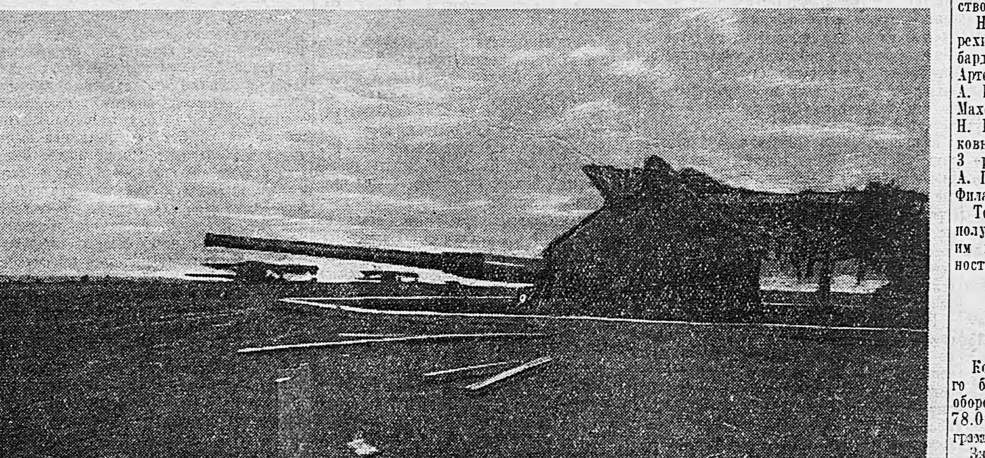
На южном участке фронта Юго-западного направления. На снимке: артиллерия на огневой позиции. (См. отерк К. Симонова на 4-й странице).

Коллектив Краснознаменного Саратовского бронетанкового училища внес в фонд обороны 53.500 рублей наличными, на 78.000 рублей облигаций госзаимов и 59 граммов золота. Значительный взнос — 15.000 рублей наличными и облигациями на сумму 105.000 рублей — сделан также тов. Селезко.