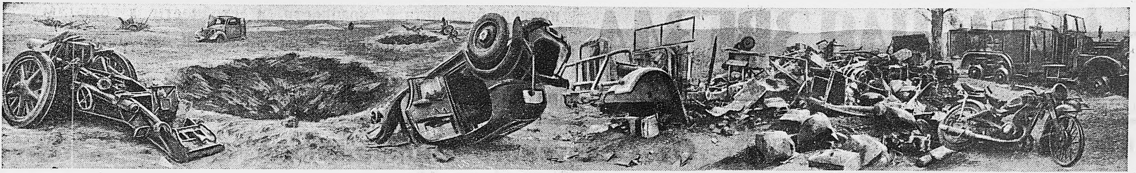
На снимке: результаты одного из налетов советских бомбардировщиков на мотоциклетную танковую группу Гудериана.