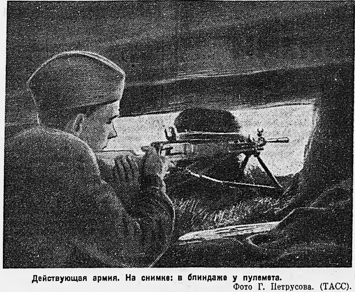
Действующая армия. На снимке: в блиндаже у пулемета.