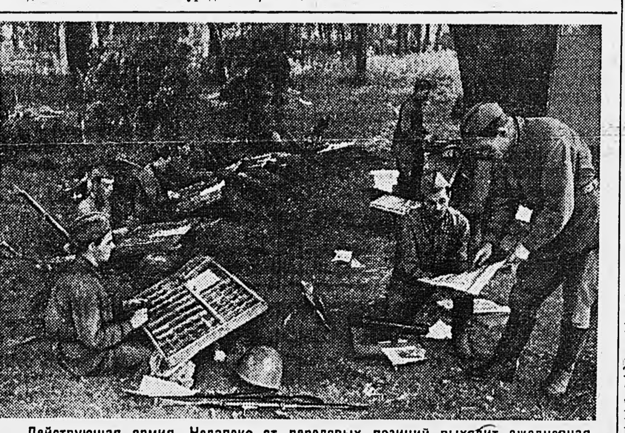
Действующая армия. Недалеко от передовых позиций выходит ежедневная красноармейская газета «Защитник родины». На снимке: верстка газеты «Защитник родины».

ЮГО-ЗАПАДНОЕ НАПРАВЛЕНИЕ. 16 сентября. (От наш. спец. корр.). Когда часть вынуждена была временно оставить остров Хортица, несколько тяжело раненых бойцов попали в плен к немцам. Началась дикая расправа с пленными, на которую способны только фашисты. Местные колхозники со слезами на глазах рассказывают о муках красноармейцев, попавших в лапы врага: им отрезали руки и ноги, выкалывали глаза, вспарывали живыми, насыпая туза песка. Но и этого было мало. Зверя-фашисты вывезли из пленников, придумывая особые мучительные казни. Одно красноармейца после страшных пыток бросили в котел с керосином и сожгли. Человек согревал, осталась только кисть правой руки. Ито-то возмущу в судорожном сжатии пальцы дрожно с красным флажком. Бойцы, вновь занявшие остров, нашли эту руку с красным флажком — руку зверски замученного воина Красной армии. Истерзанные тела красноармейцев лежали несочоренными, пока остров не был окончательно очищен от фашистской грязи. Они до такой степени изуродованы, что