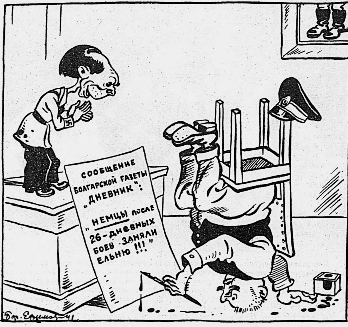
Рис. Бор. Ефимова. Текст Мих. Голодного.

Доволен Геббельс: это — труд! Вот это — вдохновение! Вниз головой подант И фанты, и подант. Подобно, как сон, впервой Встает перед глазами! Сидит хлюпый вниз головой И брешет вверх ногами.