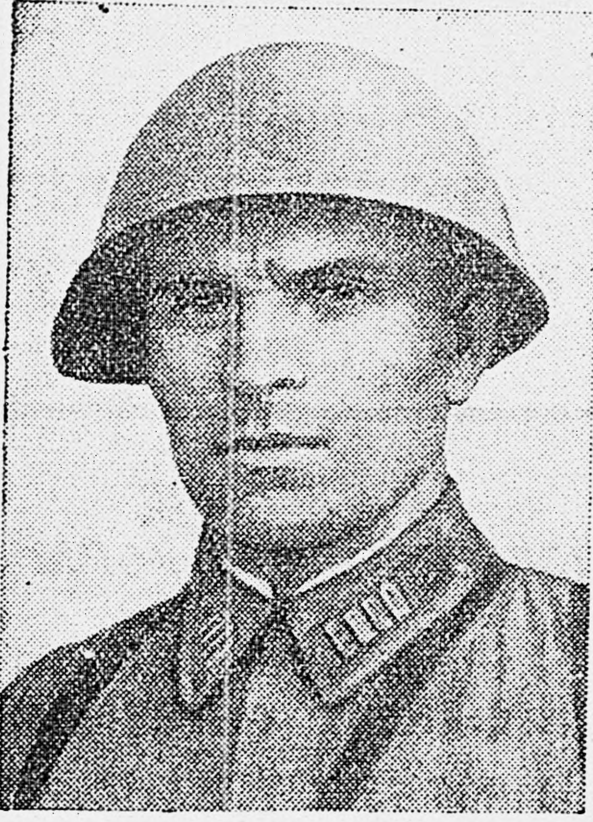
Герой Советского Союза полковник И. М. Некрасов.