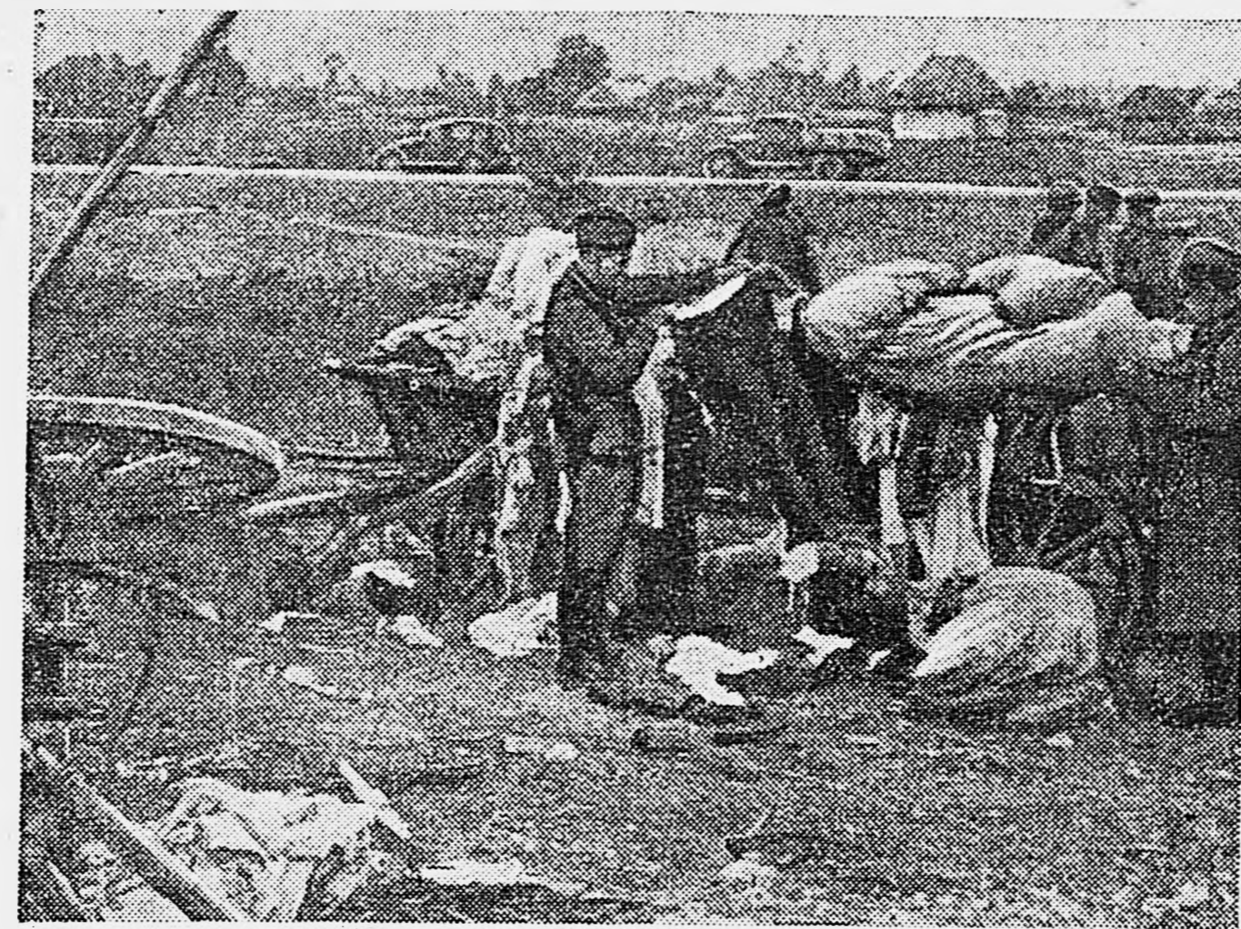
Ворвавшись в одно из сел на Юго-западном направлении, фашисты, как всегда, бросились грабить население. Контратака наших частей помешала мародерам. Они панически бежали из села, не успев захватить награбленное имущество колхозников. На снимке: бойцы рассматривают «трофеи», брошенные фашистами.

Атаку немцы проводят плотной группировкой на узком фронте, стремясь прорвать оборону на стыках (расчет на ее малую глубину), а затем провалить охват паче обход. Делается это чаще всего ограниченными силами. Если обороняющиеся сохраняют спокойствие после артиллерийской и авиационной подготовки и примет нужные меры против охватывающих групп, тактике действия немцев безуспешно не могут иметь успеха. Фашистские отряды иногда проникали в расположение нашей обороны через промежуток между подразделениями, стойко выдерживавшим авиационную и артиллерийскую подготовку. Однако их всегда от-