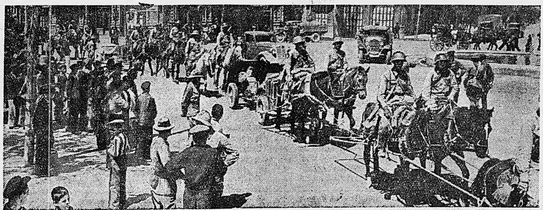
Советские войска в Иране. На снимках: части Красной армии на улицах Тавриса. В центре—полнотрук раздает жителям Тавриса пистолеты. (Снимки доставлены на самолете летчиком В. Митсевым).