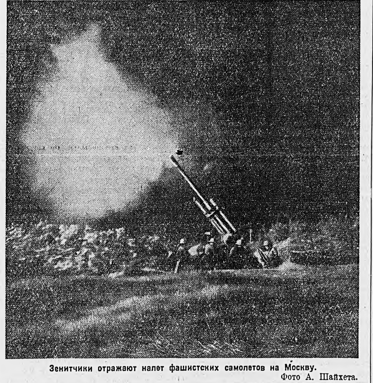
Зенитчики отражают налет фашистских самолетов на Москву.