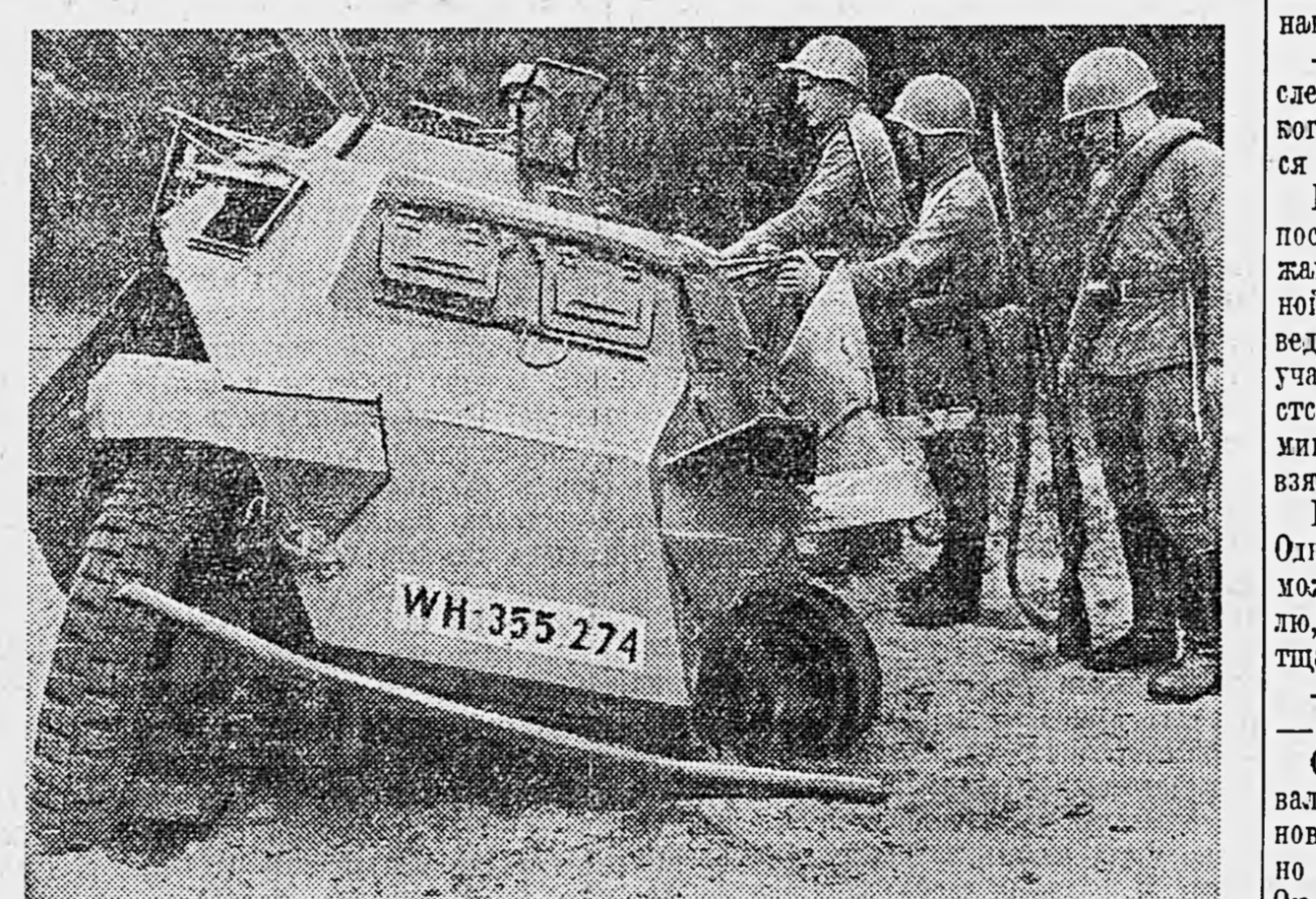
Действующая армия. На снимке: саперы осматривают фашистскую бронемашину, взорвавшуюся на минном поле впереди нашей обороны.

Во время воздушного боя основным вражеским снарядом был пробит фюзеляж и фюзеляжный бак на самолете старшего лейтенанта. Тем не менее отважный воздушный боец продолжал сражаться и совершил посадку на своем аэродроме лишь после того, как немецкие самолеты обратились в бегство.