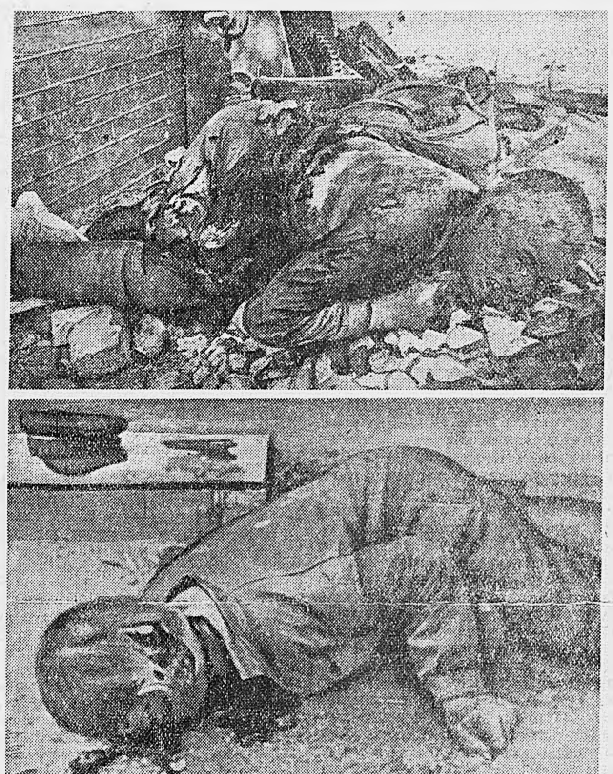
На снимках: сверху — группы красноармейцев и командиров Красной армии, сожженных немцами после тяжелых пыток и издевательств в г. Острове; внизу — зверски убитый германскими фашистами в г. Острове рабочий железнодорожники. Ему выстрелили в голову разрывной пулей.