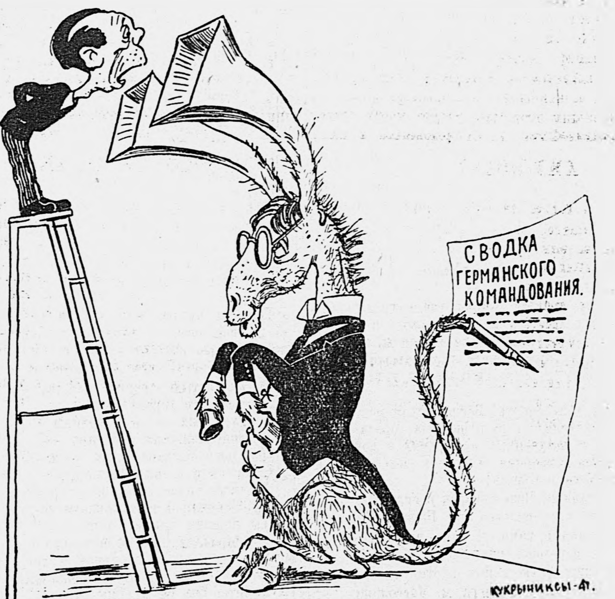
Рисунок художников КУКРЫНИНСЫ.

Ослу-бедняга невдомек — Он спрашивает глухо: — На запад, или на восток — Куда направить укол? А вдруг на север, или на юг? Скажи мне, мой двуногий друг,