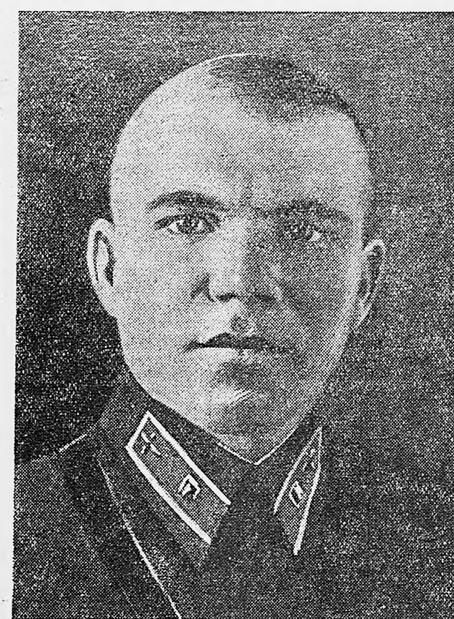
Герой Советского Союза младший лейтенант С. Г. Ридный.