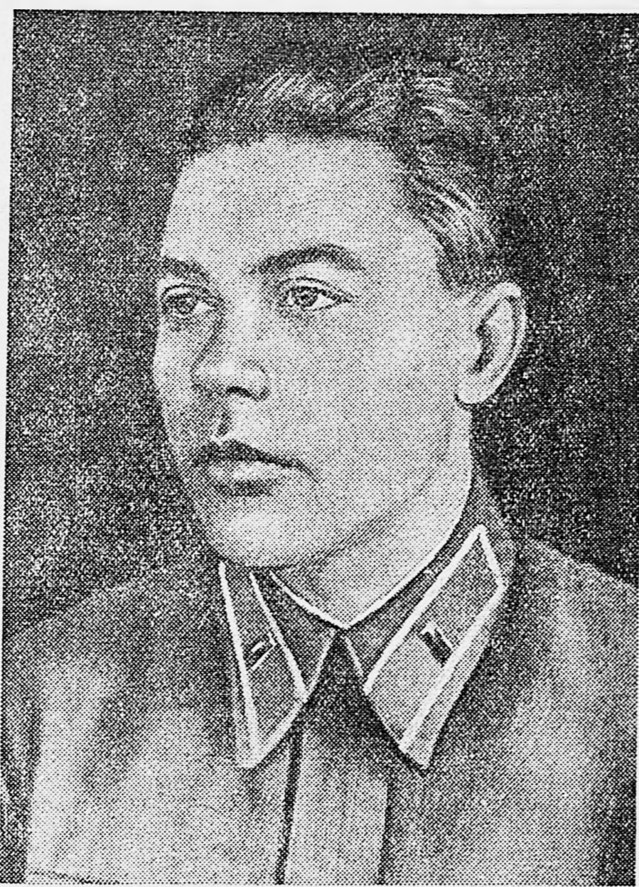
Герой Советского Союза капитан Ф. А. Баталов.