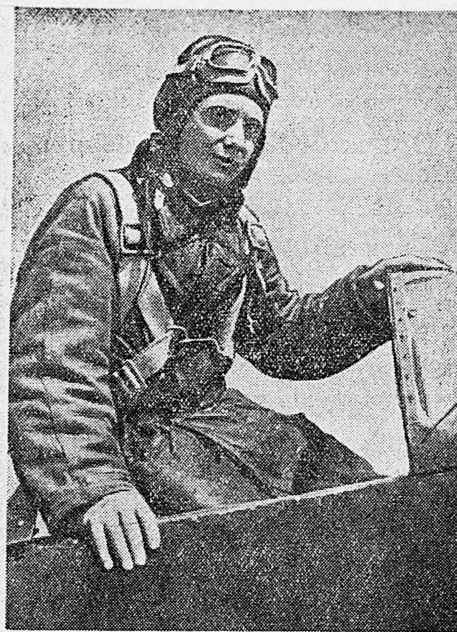
Герой Советского Союза лейтенант В. Г. Каменщиков.