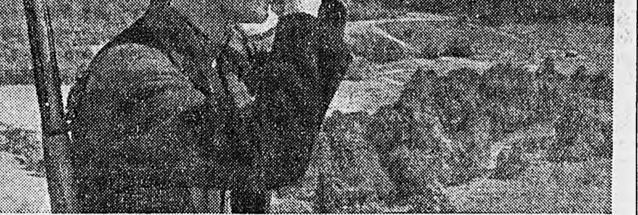
Действующая армия. Партизаны помогают частям Красной армии добывать ценные сведения о враге. На снимке: партизан А. наблюдает за продвижением отрядов немецко-фашистских войск.