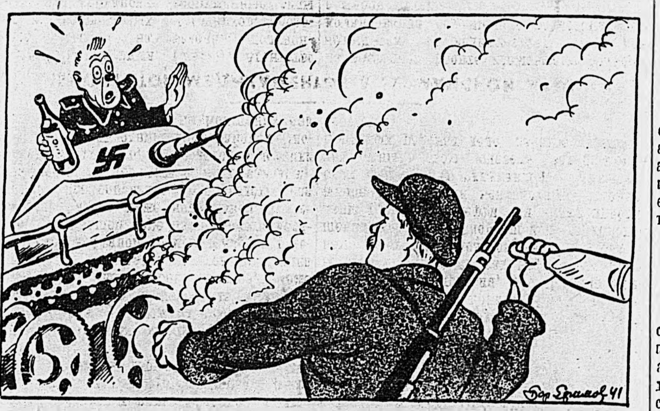
Хлебнувши «шнапсу» для веселья, в машину сел фашист германский.