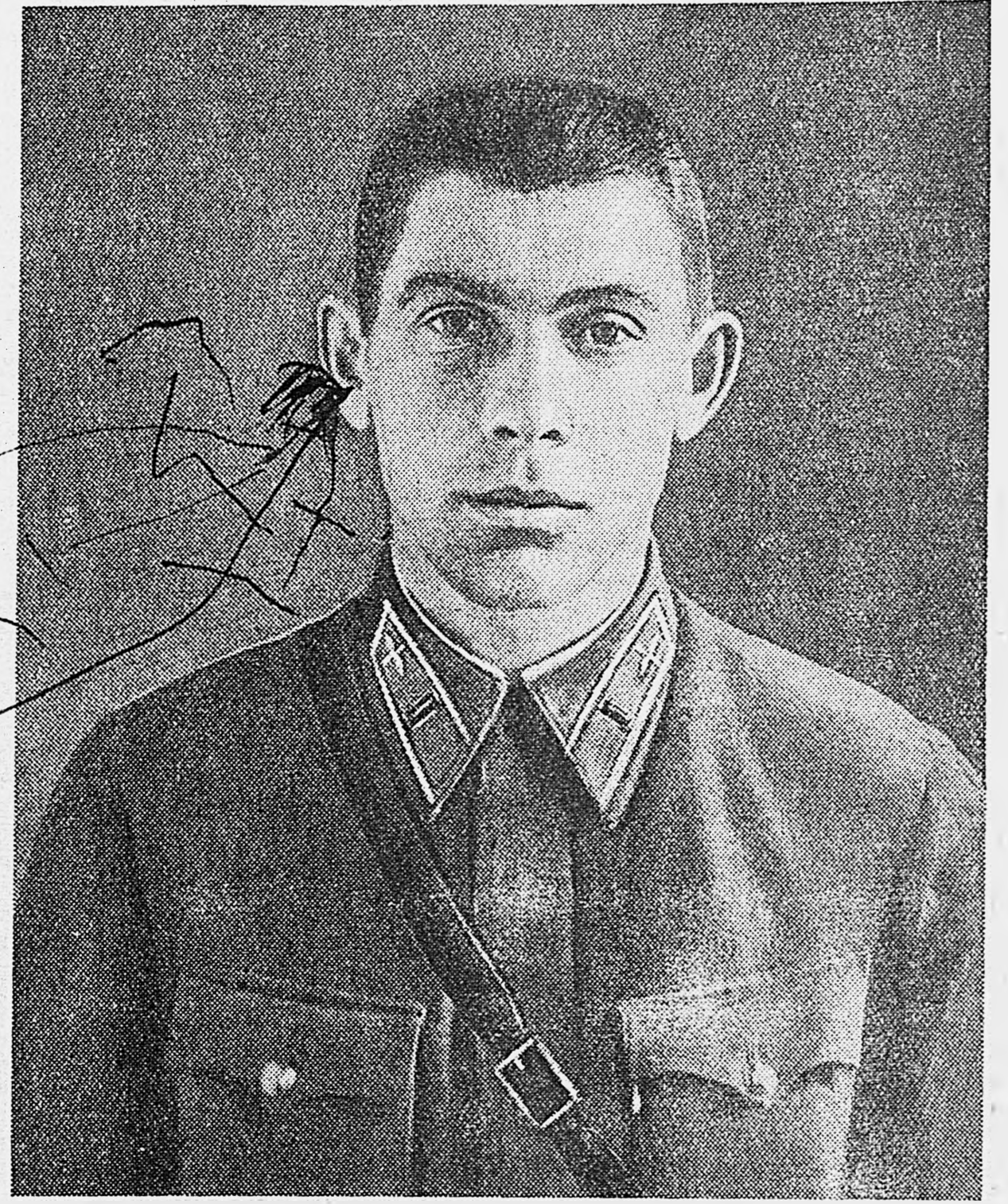
Герой Советского Союза капитан Н. Ф. Гастелло.

С именем великого Сталина наши отцы и братья громили врагов, посягавших на советскую землю. Под водительством вождя Красной армии товарища Сталина вперед, советские богатыри, на разгром гитлеровских людоедов.