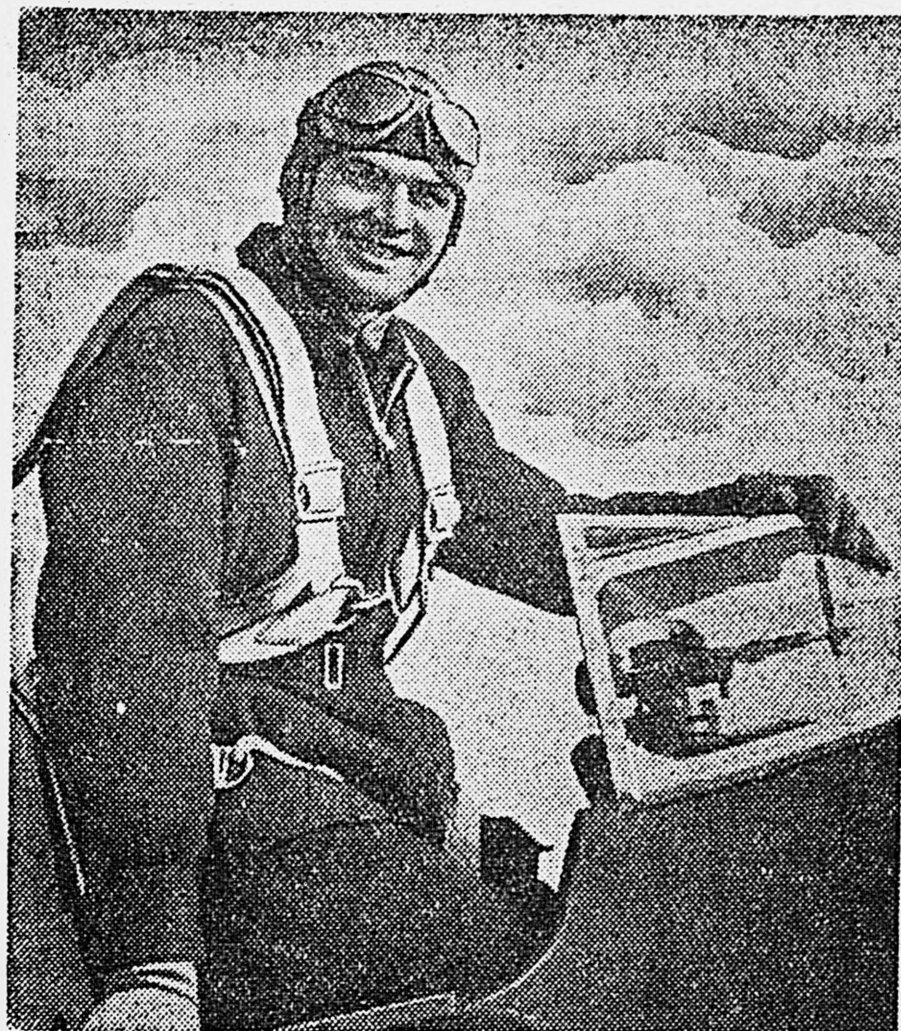
Дважды Герой Советского Союза подполковник С. П. СУПРУН.